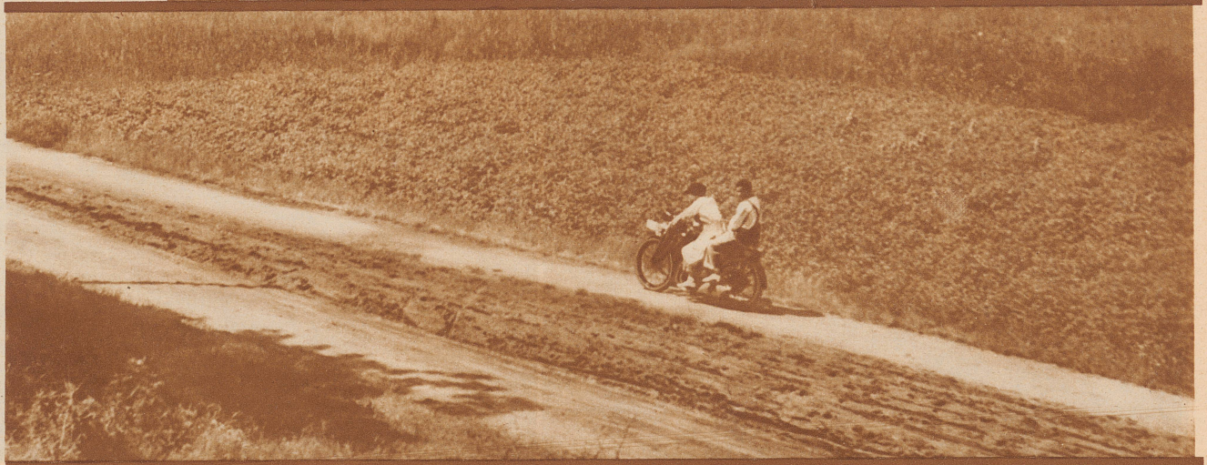
Sonntagsglück auf der Landstraße