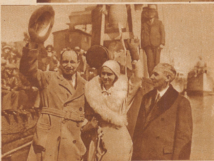
Von links nach rechts: Der Polarforscher Hubert Wilkins, Kommandant des «Nautilus», seine Gattin und der Enkel des Schriftstellers Jules Vernes, der die Expedition mitmachen wollte