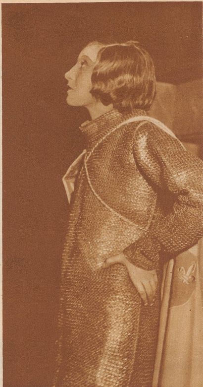
Die Jungfrau von Orleans — vor dem Auftritt

«Nein, nicht. Wir wollen's ungezwungen machen. Dieses Kleid ist reizend. Nehmen Sie nur das grüne