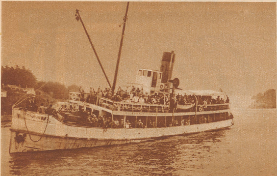
Der verunglückte Dampfer «St. Philibert» mit den Sonntagsausflüglern an Bord in der Loiremündung