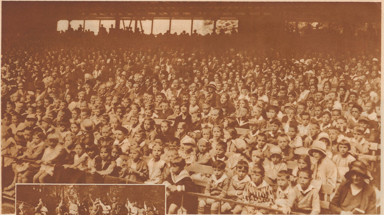
Eine aufmerksame Kinderschar im riesigen, gedeckten Zuschauerraum