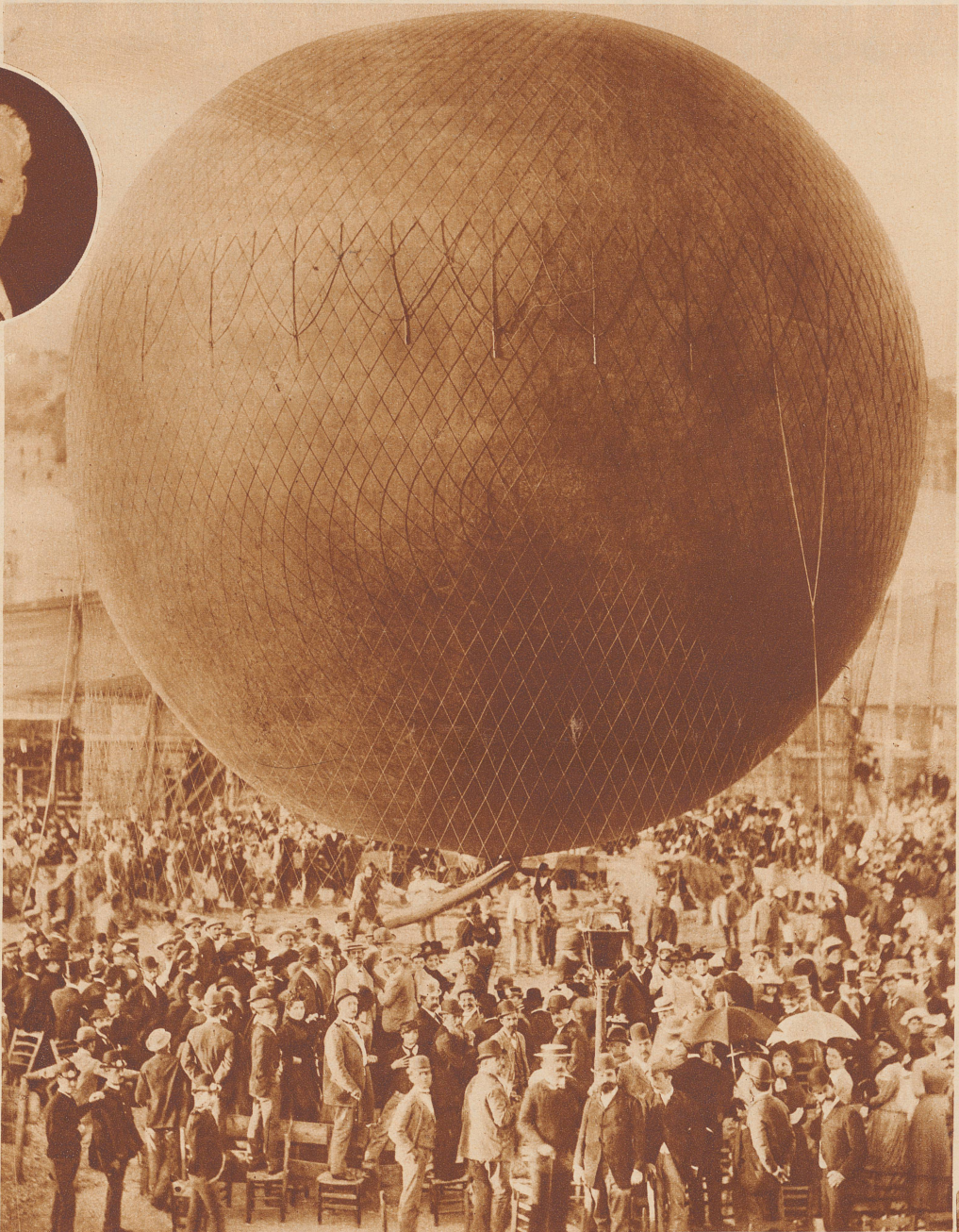
Bild rechts: Im Jahre 1891 gelang Spelterini ein mehrstündiger Flug über den Vesuv. Das Bild zeigt uns seinen Ballon kurz vor dem Start in Neapel, und gibt uns gleichzeitig einen Begriff von der Mode jener Zeit. Diese seltene Foto wurde der «Zürcher Illustrierten» von Herr Oberstleutnant Sant-schi freundlich zur Verfügung gestellt

Bild unten: Teilsicht der Stadt Johannesburg in Transvaal, eine Aufnahme Spelterinis aus den Neunziger Jahren. Ein Bild der zweckbetonten Anlage dieser Stadt, das wir heute schon gewohnt sind, das aber damals, als es entstand, durchaus neu wirkte Wehli-Verlag