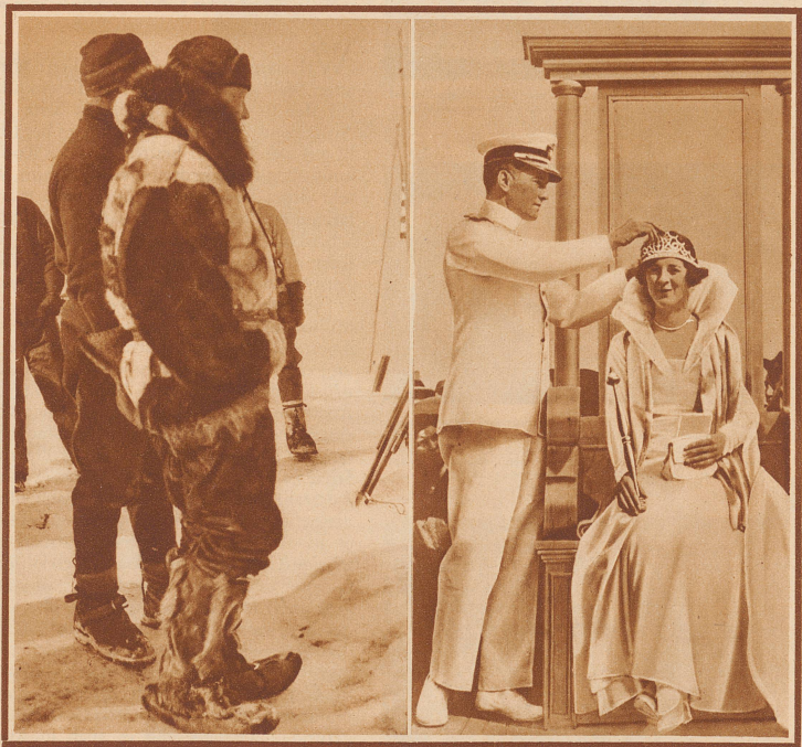
Byrd vor 2 Jahren: in der Eiswüste der Antarktis gefährdet und zu großen Taten entschlossen