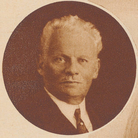
Kapitän Spelterini zur Zeit seines letzten Aufstieges im Jahre 1926