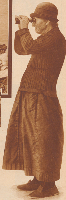
Im Hafen von St-Nazaire erwarten die Angehörigen der Verunglückten die Ankunft der Bergungsdampfer. Unser Bild zeigt eine in ihrer Trübsal erhabene Szene: eine alte Frau hält Ausschau nach dem Schiff, das ihr die toten Verwandten wiederbringen soll.

Der Untergang des Bergungsdampfers 'St. Philberts' ist eine der größten Katastrophen, von der die französische Schifffahrt betroffen wurde. Bis jetzt sind mehr als 300 Entsetzte geborgen worden. Die Suche nach weiteren Opfern dauert an und täglich werden noch Leichen in großer Zahl aufgefunden. Bild: Der Bergungsdampfer 'La Loire' sucht eine traurige Fracht an dem Dock von St-Nazaire.