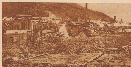
Wirbelsturm über Westfalen. Am 17. Juni wurde Westfalen von einem schweren ozeanischen Wirbelsturm heimgesucht, der an mehreren Orten großen Schaden anrichtete. Am schwersten wurde die Stadt Pletzenburg von dem Unwetter betroffen. Die Pletzenburger Dachstuhlwerke sind vollständig zerstört. In dieser großen Fackelkathedrale wurden Dächer von Sturm fortgerissen, Kamine niedergelassen und ganze Gebäude weggerissen, so daß nur das Fundament zurückblieb. Die Katastrophe forderte mehrere Tausend Opfer.