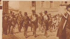
Aus den Rettungsfeierlichkeiten der ersten 77 Todesopfer des Schiffbruchs des 'St. Philberts' in Nantes nahm auch Burreich teil.