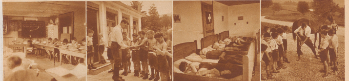
Die neue Schulstube auf dem «Hoggen»