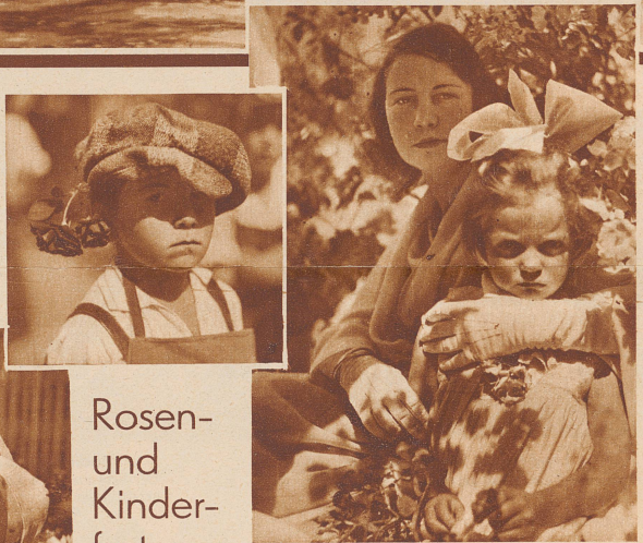
Bild unten: Am Kinder-Blumenkorso der Rosenkönigin nahm eine mächtige Seerosen teil, deren lebendige Füllung die Zuschauer entzückte

Bild rechts: Am Weggiser Rosenfest trägt jedermann eine Rose: im Knopfloch, in den Händen, im Haar usw. Dieser Festzugsteilnehmer hat sich die Rose als Gegengewicht an die schiefe Mütze gehängt