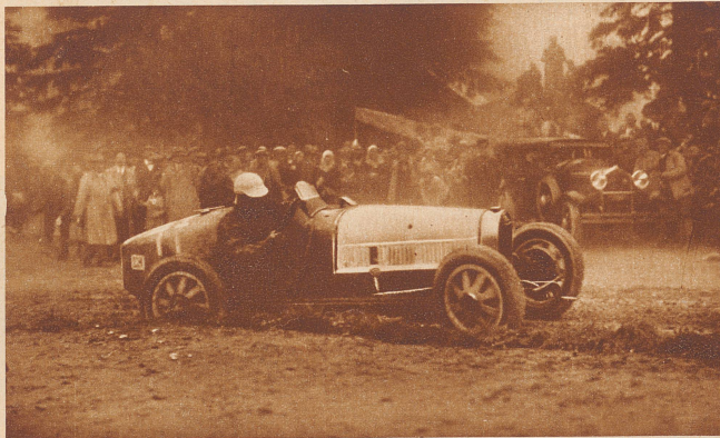
Beim diesjährigen Gurnigelrennen siegte der Berner Stuber auf «Bugatti» in der Rennwagenklasse. Er fuhr die beste Zeit des Tages und legte die Strecke, arg behindert durch Nebel und schlechten Weg, in 8 Minuten, 40,2 Sekunden zurück