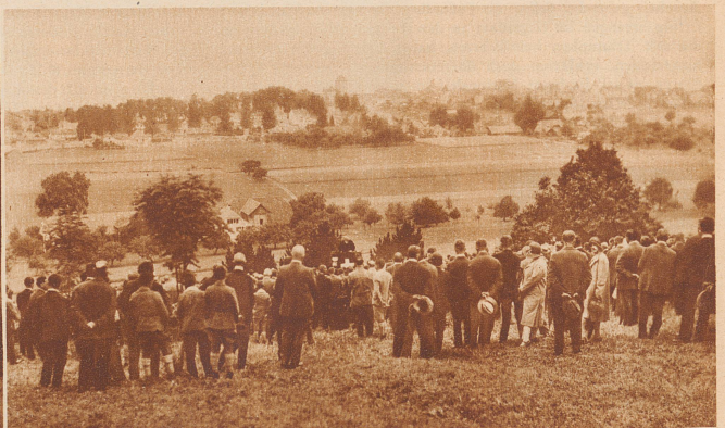
Am zweiten Murtenschiefen , das vergangenen Sonntag durchgeführt wurde, beteiligten sich 89 Gruppen mit rund 800 Teilnehmern aus allen Teilen der Schweiz. Das Schießen wurde mit einer Feldpredigt eröffnet und nahm bei günstiger Witterung einen guten Verlauf