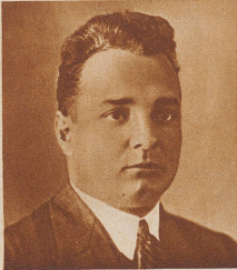
Als Nachfolger von Regierungsrat Bay wurde der gegenwärtige Landratspräsident

wurde vom Bundesrat zum ordentlichen Professor für Betriebswissenschaft an der E. T. H. und Direktor des betriebswissenschaftlichen Institutes in Zürich ernannt