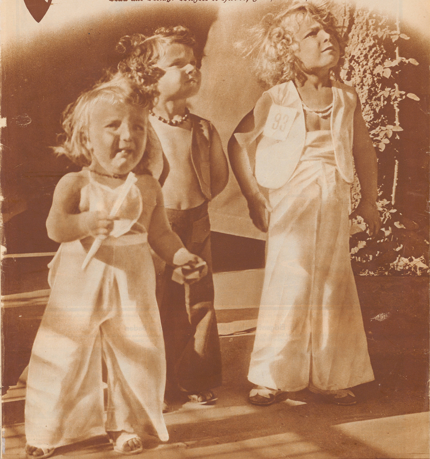
Drei aus dem Pyjamaland. Strandanzüge gehören zu den schönsten Mode-Erfindungen des Jahres 1931: sie sind praktisch, schön und unerschöpflich in ihren Erscheinungsformen. Nun gibt es sogar schon solche für die Jahrgänge 1920—1927, und in den Badeorten der Riviera kann man die Knirpse in richtigen «Modeschauen» — die neuesten Modelle vorführen sehen