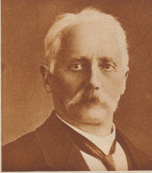
In Luzern starb im Alter von 73 Jahren Ingenieur

in die basellandschaftliche Regierung gewählt. Der neue Regierungsrat, früher Redaktor, gehört der sozialdemokratischen Partei an