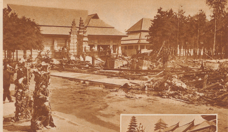
Brandkatastrophe in der Pariser Kolonialausstellung. In der Nacht vom 27. zum 28. Juni ist der holländische Pavillon der Pariser Kolonialausstellung durch Feuer vollständig zerstört worden. Der Pavillon war rein baulich ein Clou der Ausstellung und enthält unerschöpfliche Werte für den Kunst- und Kultur- des ostindischen Inselreichs. Der Schaden beläuft sich auf mehr als 10 Millionen Gulden. Will rechnet die Pavillon vor dem Brande. Oben: Die Überreste des Millionenschaus