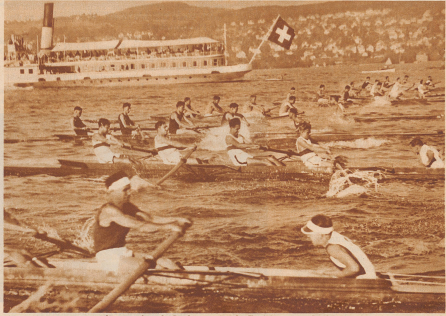
Internationale Ruderregatta in Zürich, 27. 28. Juni 1931 Start der Gäste-Vierer mit Steuermann, in welcher Kategorie die Société Nautique «Flecken» Bild Sieger blieb