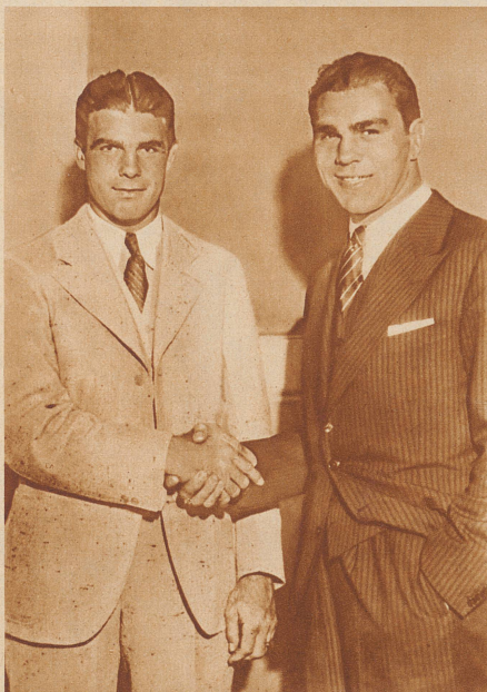
Bei dem Boxwettkampf um die Weltmeisterschaft im Schwergewicht, die vergangenen Freitag vor 35 000 Zuschauern in Cleveland ausgetragen wurde, siegte in der 15. Runde der Deutsche Max Schmeling über den Amerikaner Young Stribling. Unser Bild zeigt die beiden Rivalen unmittelbar vor dem Kampfe

Rechts nebenstehend: In Luzern wurde kürzlich das von dem Architekten Berger umgebaute und erweiterte eidgenössische Versicherungsgerichtsgebäude feierlich eingeweiht. Unser Bild zeigt die vom Architekten M. Piccard entworfene Inneneinrichtung des Gerichtssaales. Der Wandschmuck, ein Hochrelief, stammt von Hermann Hubacher.