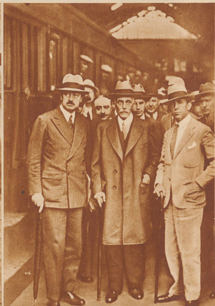
Zu den französisch-amerikanischen Verhandlungen über den Hoovervorschlag in Paris hat Amerika den Staatssekretär Mellon beordert. Bild: Mellon bei seiner Ankunft in Paris