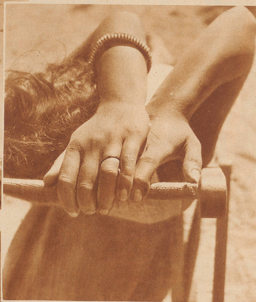
Ruhe im Liegestuhl