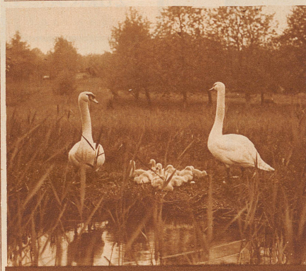
SCHWANE AM HALLWILER SEE

Wie diese Schwäne ihre Brut beschützen, so wachen kundige Hände über die Herstellung einer stets guten Qualität der bekannten