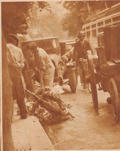
Zwei historische Aufnahmen. Zürich will eine Großstadt werden und rückt ihren kleinstädtischen Idyllen immer mehr auf den Leib. Am 30. Juni ist der Gemüsemarkt, ein Anziehungspunkt für Weltreisende und kurzweiliges Einkaufsgebiet für Hausfrauen und Dienstmädchen, dem Moloch Verkehr zum Opfer gefallen. Man hat den Markt vorläufig, bis das Markthallenprojekt verwirklicht wird, der stillen Seepromenade zugeführt. Unsere zwei vorliegenden Aufnahmen dürften mit der Zeit einen gewissen historischen Wert bekommen: es sind Bilder vom letzten Markttag.

so sucht sein erster Blick Lore; ist diese nicht anwesend, so wird er ungeduldig oder schweigsam. Und Lores Augen leuchten auf, wenn er zu ihr spricht, sie trinkt ihm die Worte von den Lippen.