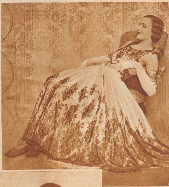
Weißer Georgette mit Applikationen aus schwarzer Chantilly-Spitze; der weite Rock ist so lang, daß er leicht schleppt. Statt der Aermel lange weiße Glacé-Handschuhe, deren Rand das Spitzenmotiv wiederholt