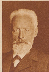
In Zürich starb 82 Jahre alt J. J. Müller. Er war Gründer des Nordostschweizerischen Turnverbandes, tätiger Vorkämpfer der modernen Turnerei, und leitete 29 Jahre lang den militärischen Vorunterricht. Lange Zeit war er Redaktor der Schweizerischen Turnzeitung und gehörte verschiedenen Zürcher Behörden an