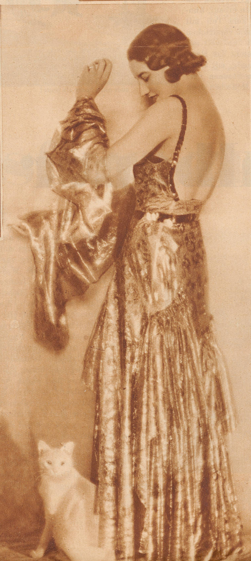
Im Rücken frei: die Abendkleider machen es den Badetrikots nach, - vorne steigen sie an, rückwärts werden sie immer sparsamer. Auch dieses wunderschöne Abendkleid aus Goldspitze auf schwarzem Grund setzt hinten erst ganz knapp über dem schwarzen Jetgürtel an und wird nur durch schmale Achselbänder aus dem gleichen Material gehalten