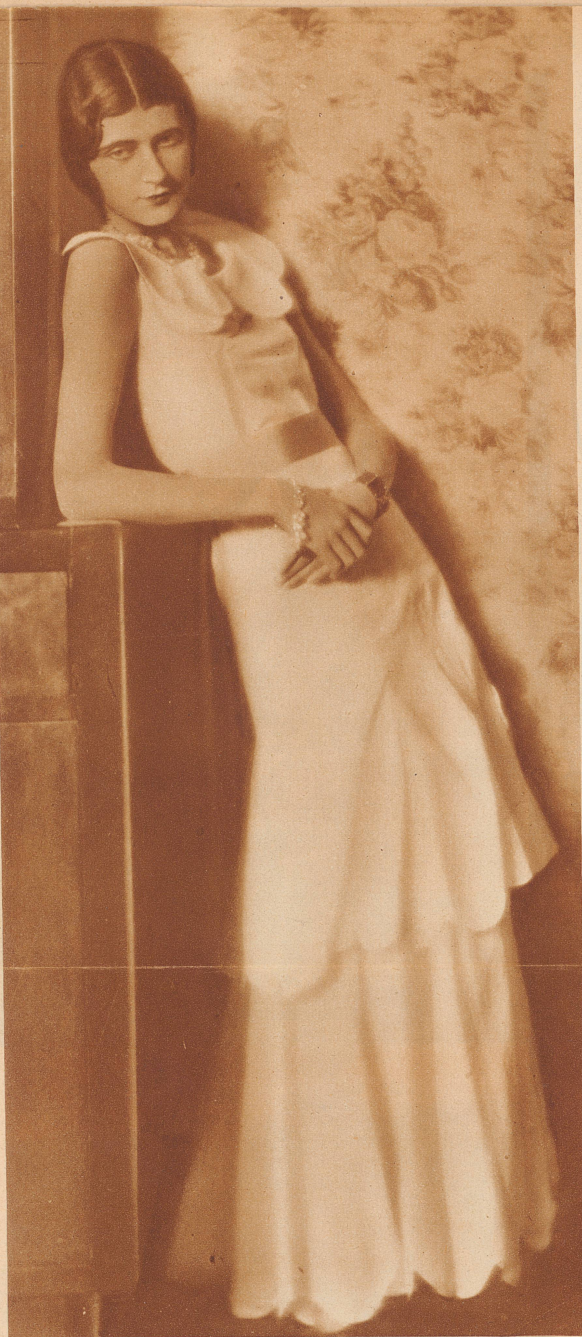
Bild links: Ein Sommerkleid für die vielen Gartenfeste: Hellgelber Crêpe Satin mit breitem blauem Gürtelband, - eine vornehme, wenig unterbrochene, stille Linie