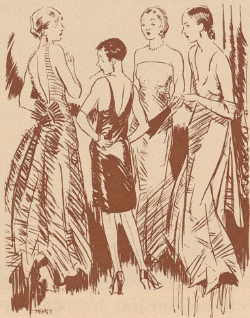
Die Emanzipierte von gestern im Kreuzfeuer der Verachtung: «O Gott, ist das ein altmodisches Geschöpf!» (Everybody)