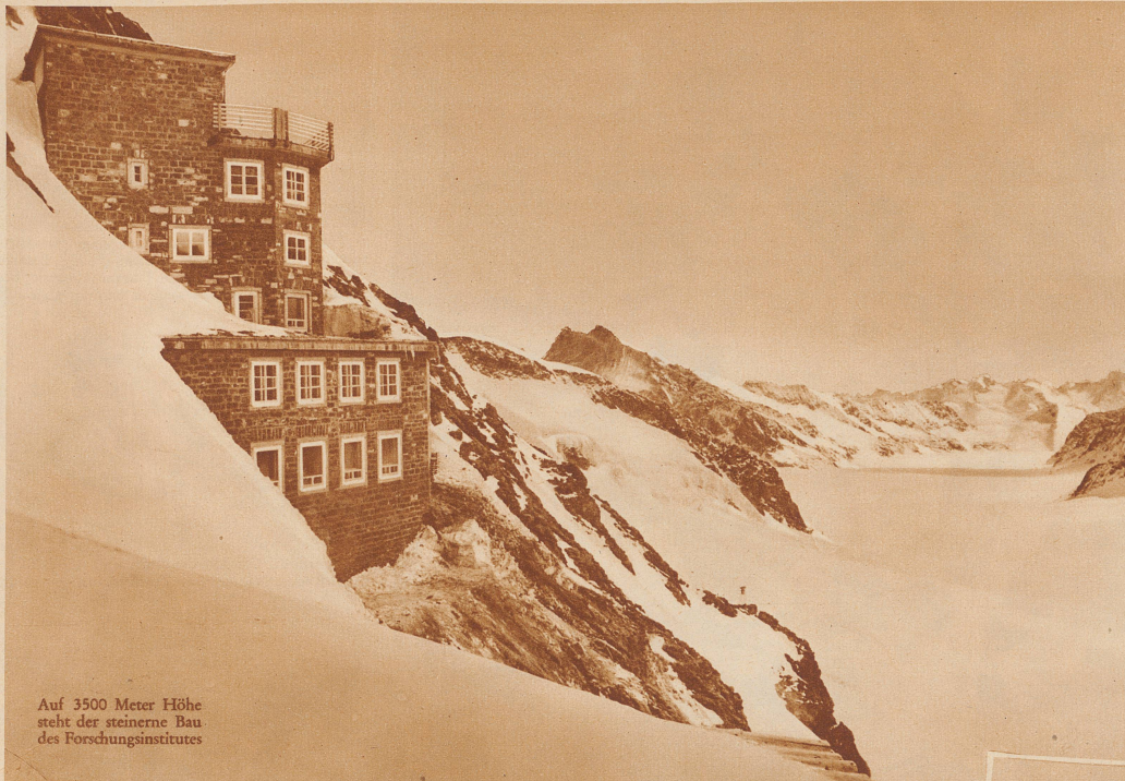
Auf 3500 Meter Höhe steht der steinerne Bau des Forschungsinstitutes