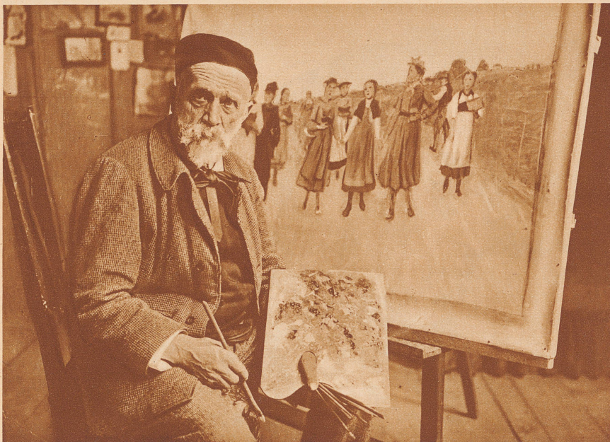
Der Maler Albert Anker , aufgenommen 1904 in seinem Heim in Ins.

Anlässlich des hundertsten Geburtsjahres Albert Ankers veranstaltet das Kunstmuseum Bern eine Gedächtnis-Ausstellung seiner Werke