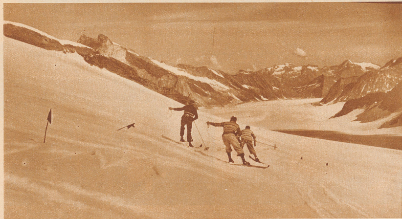
Abfahrtsrennen am Seil