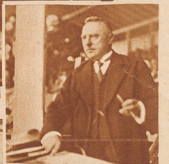
Bundesrat Minger auf der Tribüne