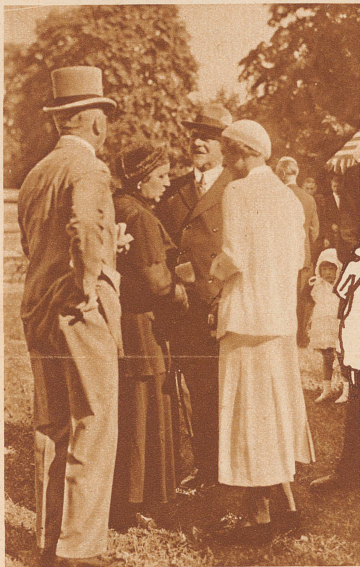
Hohe fremde Gäste auf dem Rennplatz: Der Prinzgemahl von Holland (Mitte) im Gespräch mit Freiherrn von Holzing-Berstett (Deutschland)