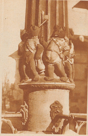
Der Mutz - Berns Wappentier - ziert, bepanzert und bewehrt, die meisten Brunnen der Stadt