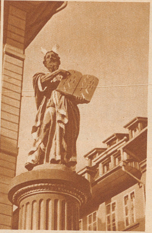
Moses mit den Gesetzestafeln