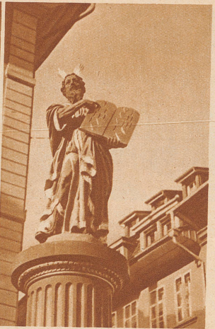
Moses mit den Gesetzestafeln