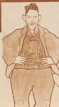
Karikatur für den «Grünen Heinrich» von Frieda Liermann (Mai 1907)