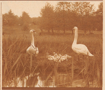
SCHWANE AM HALLWILER SEE

Wie diese Schwäne ihre Brut beschützen, so wachen kundige Hände über die Herstellung einer stets guten Qualität der bekannten Hallwiler Forellen