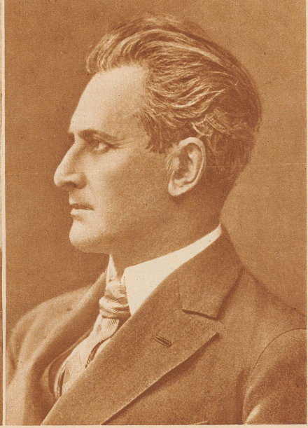
Friedrich Gundolf , der größte deutsche Literaturhistoriker, Verfasser genialer Untersuchungen über Kleist, Hutten, Caesar, Paracelsus, Goethe und andere große Kampfgeister in Geschichte und Literatur, ist 51 Jahre alt plötzlich gestorben. Seit 1920 lehrte er an der Universität Heidelberg. 1930 wurde ihm der Kleistpreis verliehen. Sein größtes Werk, «Shakespeare und der deutsche Geist» hat viel dazu beigetragen, die Bedeutung des großen englischen Dramatikers auch den Heutigen verständlich zu machen