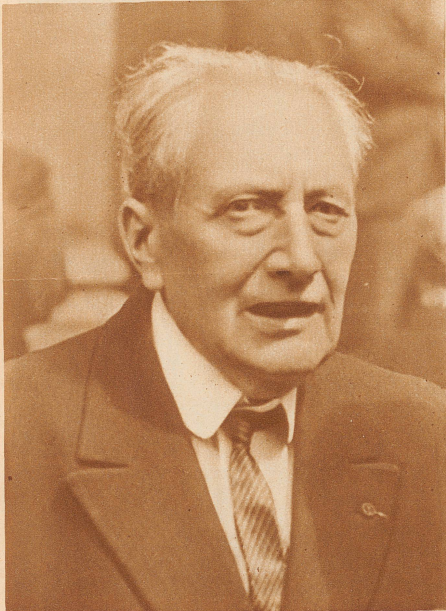
Jean Louis Forain , der bekannte Zeichner, starb in Paris im 79. Altersjahr. Während eines halben Jahrhunderts hat er durch sein zeichnerisches Genie und seinen scharfen Witz über Paris regiert. Er war ein Gesellschaftskritiker ersten Ranges in der großen Linie der französischen Moralisten der Vergangenheit