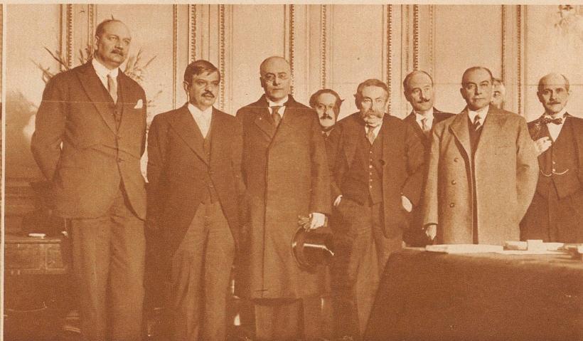
Zum Zwecke der Besprechung der schwierigen Finanzlage Deutschlands sind Reichskanzler Brüning und Außenminister Curtius nach Paris und London gerüstet. Die Teilnehmer der Pariser Konferenz, von links nach rechts: Flandin, Ministerpräsident Laval, Reichskanzler Brüning, Briand, Außenminister Curtius, Piétri und Ph. Berthelot

Die «Zürcher Illustrierte» erscheint Freitags • Schweizer Abonnementspreise: Vierteljährlich Fr. 3.40, halbjährlich Fr. 6.40, jährlich Fr. 12.—. Bei der Post 30 Cts. mehr. Postscheck-Konto für Abonnements: Zürich VIII 3790 • Auslands-Abonnementspreise: Beim Versand als Drucksache: Vierteljährlich Fr. 4.50 bzw. Fr. 5.25, halbjährlich Fr. 8.65 bzw. Fr. 10.20, jährlich Fr. 16.70 bzw. Fr. 19.80. In den Ländern des Weltpostvereins bei Bestellung am Postschalter etwas billiger. Insertionspreise: Die einspaltige Millimeterzeile Fr. —.60, fürs Ausland Fr. —.75; bei Platzvorschrift Fr. —.75, fürs Ausland Fr. 1.—. Schluß der Inseraten-Annahme: 14 Tage vor Erscheinen. Postscheck-Konto für Inserate: Zürich VIII 15769