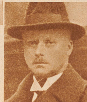
Karl Lahusen , der Generaldirektor der «Nordwolle», Deutschlands größtem Wollkonzern. Die «Nordwolle» ist durch unglückliche Transaktionen zusammengebrochen. Der Konzern beschäftigte 47 000 Arbeiter, die Verluste gehen in die Hunderte von Millionen Mark. Lahusen ist verhaftet worden

Sturm auf die Sparkassen der Stadt Berlin. Die Zahlungseinstellung der Darmstädter- und Nationalbank hat bei der Berliner Bevölkerung große Aufregung und einen Sturm auf die Banken hervorgerufen. Auf Grund einer Notverordnung wurden alle Abhebungen über 100 Mk. unmöglich gemacht