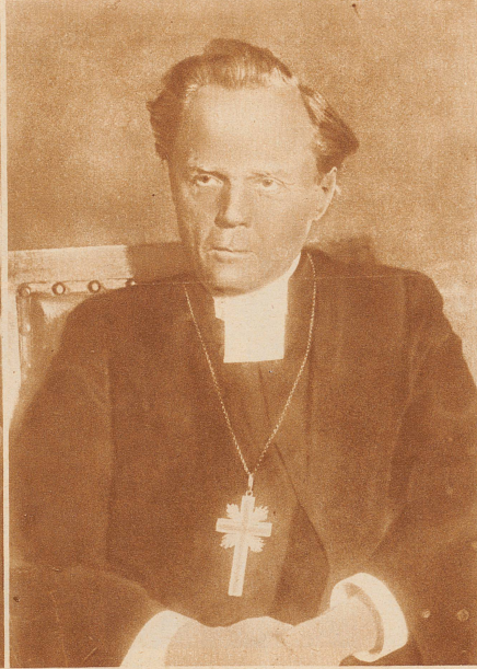
Erzbischof Soederblom . An den Folgen einer Operation starb in Stockholm im 65. Altersjahr der evangelische Erzbischof Nathan Soederblom. Er war eine der bekanntesten christlichen Persönlichkeiten unserer Zeit, besonders bekannt geworden durch seine großzügige Liebestätigkeit im Krieg. Nach dem Kriege trat er immer stärker in den Vordergrund der kirchlichen Einigungsbestrebungen. 1926 präsiidierte er die Lausanner Weltfriedenskonferenz. Er war Ehrendoktor aller vier Fakultäten und Nobelpreisträger