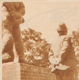
Wie oft kann man beobachten, daß Beschauer sich in eindringliche Plastiken so hineinversetzen, daß sie unwillkürlich die Haltung des Dargestellten einnehmen