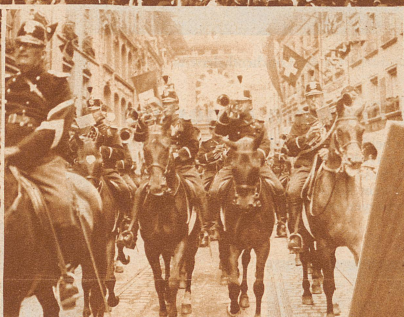
Die Berner Reiter-Musik in der alten, bunten Uniform der schweizerischen Kavallerie im Festzug