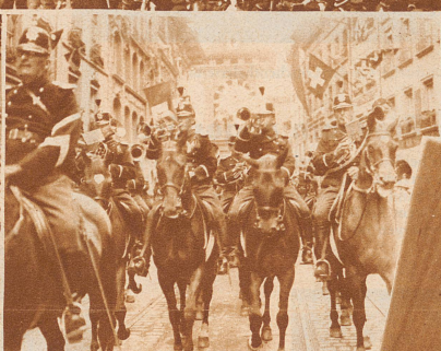
Die Berner Reiter-Musik in der alten, bunten Uniform der schweizerischen Kavallerie im Festzug