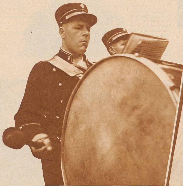
Tschingtsching, Bumbum und Paukenkrach . . . .

Die «Zürcher Illustrierte» erscheint Freitags • Schweizer Abonnementspreise: Vierteljährlich Fr. 3.40, halbjährlich Fr. 6.40, jährlich Fr. 12.-. Bei der Post 30 Cts. mehr. Postscheck-Konto für Abonnements: Zürich VIII 3790 • Auslands-Abonnementspreise: Beim Versand als Drucksache: Vierteljährlich Fr. 4.50 bzw. Fr. 5.25, halbjährlich Fr. 8.65 bzw. Fr. 10.20, jährlich Fr. 16.70 bzw. Fr. 19.80. In den Ländern des Weltpostvereins bei Bestellung am Postschalter etwas billiger. Insertionspreise: Die einspaltige Millimeterzeile Fr. -.60, fürs Ausland Fr. -.75; bei Platzvorschrift Fr. -.75, fürs Ausland Fr. 1.-. Schluß der Inseraten-Annahme: 14 Tage vor Erscheinen. Postscheck-Konto für Inserate: Zürich VIII 15769