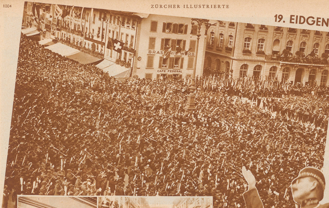
150 Vereine mit rund 6000 Musikern waren zum Eidgenössischen Musikfest nach Bern gekommen. Der Gesamtchor beim Spiel auf dem Bundesplatz