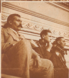
Aufmerksame Zuhörer im Kasinosaal, wo die Wettkämpfe ausgetragen wurden

150 Vereine mit rund 6000 Musikern waren zum Eidgenössischen Musikfest nach Bern gekommen. Der Gesamtchor beim Spiel auf dem Bundesplatz