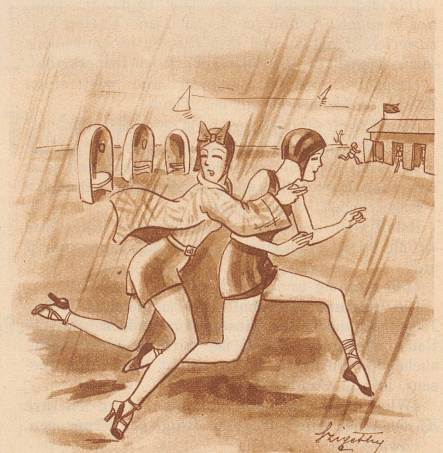
«Komm schnell, mein neues Badekostüm wird naß...»