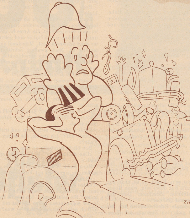
Zeichnung von R. Lips