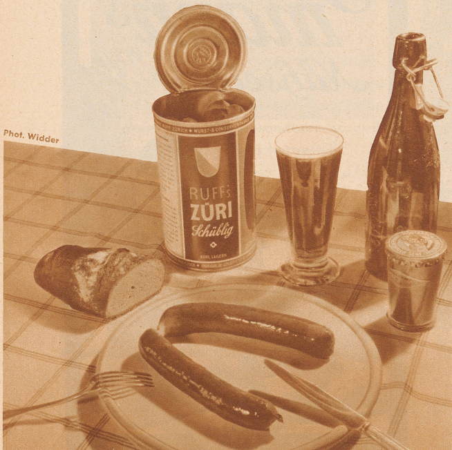
Phot. Widder Otto Ruff, Wurstfabrik und Metzgerei, Zürich

Sie schmecken ja auch wirklich ausgezeichnet: Ruff's Züri-Schüblig ! Sollten Sie sie noch nicht kennen, dann holen Sie sich doch noch heute eine Dose in einem guten Lebensmittelgeschäft oder in einer Ruff-Filiale. Ein frisches Brötchen dazu — und Sie haben ein schmackhaftes, nahrhaftes und dabei billiges Essen! Der Versand erfolgt überallhin, sogar nach Uebersee, wo wir ebenfalls schon zahlreiche Freunde von Ruff's Züri-Schüblig haben!