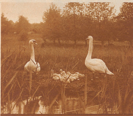
SCHWANE AM HALLWILER SEE

Wie diese Schwäne ihre Brut beschützen, so wachen kundige Hände über die Herstellung einer stets guten Qualität der bekannten Hallwiler Forellen