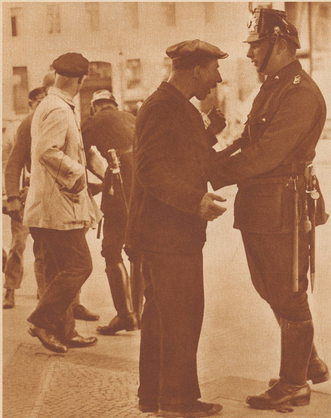
Bei den kommunistischen Tumulten vom 10. August am Bülowplatz wurden mehrere Polizei- und Zivilpersonen getötet. Ueber den Platz wurde der Belagerungszustand verhängt und alle Passanten nach Waffen durchsucht