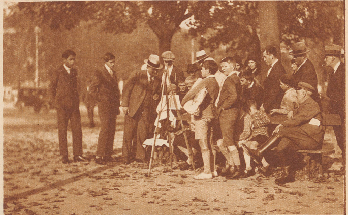
«So ein Gedränge möchte ich einmal sehen, wenn ich meine Bilder zum Verkauf anbiete», denkt die Malerin

So ein Maler kann sich also auch was denken über die Leute die ihn stören. Aufgepaßt, nicht die Kinderwagen hinstellen, damit die Kinder was zu gucken haben! Nicht ihm fast auf die Füße treten! Nicht den Rauch der Brissago ihm ins Gesicht blasen! Schont den Arbeitenden! Rücksicht ziert den Zuschauer! Maler sind Schöpfer, sie haben Nerven, schont sie! Platz dem Maler!