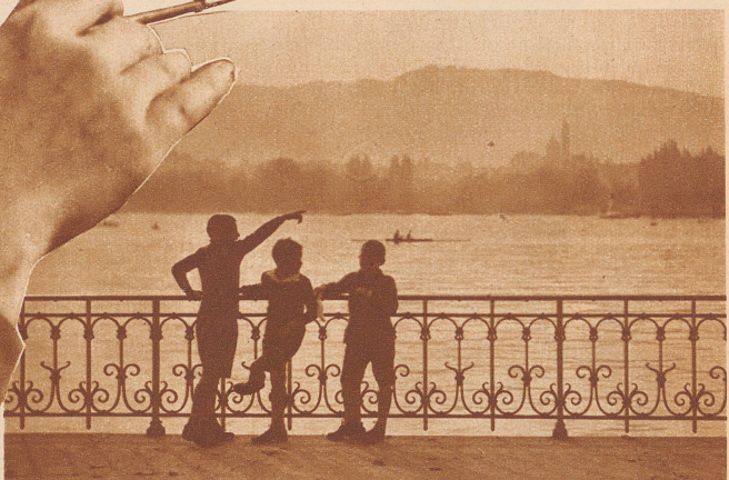
Die Landschaft, um die sich's handelt. Duftige Farben sind schwer zu treffen. Die Buben vorn könnten ebensogut anderswo spielen, aber sie fühlen sich offenbar im Bildfeld ganz besonders wohl