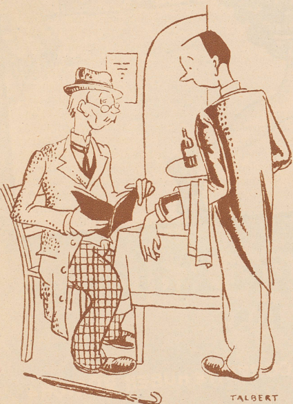
Herr Ober, ich habe doch bei Ihnen ein Schnitzel bestellt; warum bekomme ich es denn nicht? Oder haben Sie es vielleicht gebracht und ich habe es schon gegessen? Oder habe ich es am Ende noch gar nicht bestellt? (Tit-Bits)