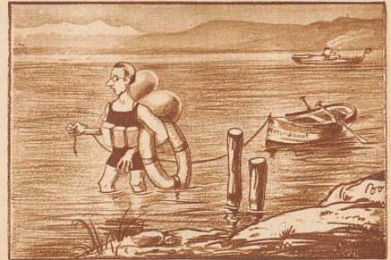
Herr Aengstlich geht baden