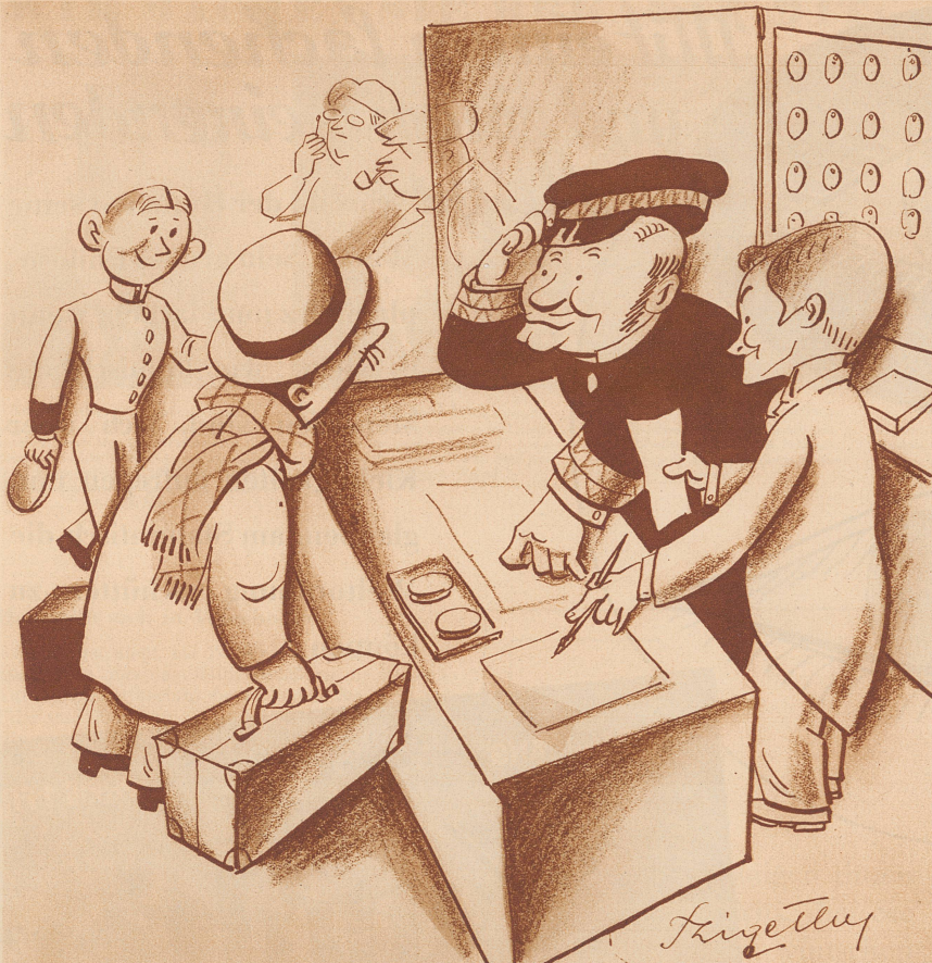
«Wollen Sie ein Zimmer mit fließendem Wasser?» «Wozu? Bin ich ein Hecht?!»