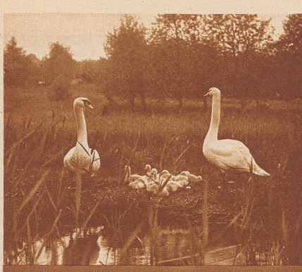
SCHWANE AM HALLWILER SEE

Komfort. Fließendes Wasser, warm und kalt, Lift; Etagenbäder; schöner Park am Rhein; Pensionspreis Fr. 9.— bis Fr. 10.50. Verlangen Sie Prospekte. Tel. 171. G. Hurl.