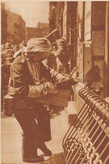
Unpolitischer Zwischenfall in Berlin.

Ein Lächeln entglitt den feingeschwungenen, natürlich roten Lippen, ein herzliches Lächeln, in dem nicht die leiseste Spur von Ironie lag. Mit der schüchternen Kühnheit eines Elementarschülers flötete ich weiter, ohne ihr Zeit zum Sprechen zu lassen: «Fräulein, ich liebe Sie. . . seit ich Sie zum erstenmal gesehen habe, liebe ich Sie! Geben Sie mir bitte Gelegenheit, um mich länger mit Ihnen zu unterhalten. Meine Absichten sind ehrlich, reell, ich