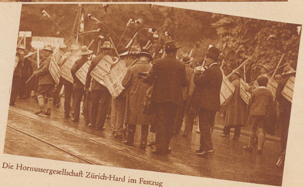
Die Hornussergesellschaft Zürich-Hard im Festzug