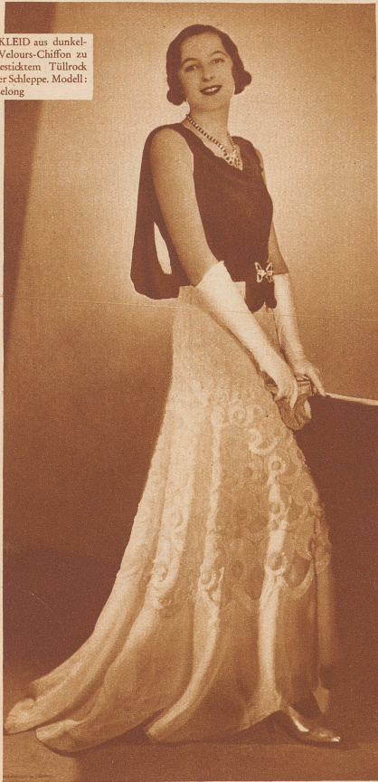
NDKLEID aus dunklen Velours-Chiffon zu henbesticktem Tüllrock kurzer Schleppe. Modell: an Lelong

Die Rückenansicht des kommenden Abendkleides: Die «Tournüre» ist wieder da!