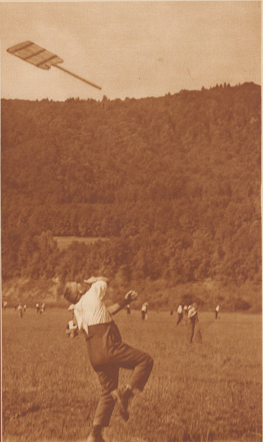
Mit wohlgezieltem Schuß der Schindel in die Luft wird der heransausende Hornuß abgetan

Bei den Eidgenössischen Schwing- und Aelplerfest in Zürich