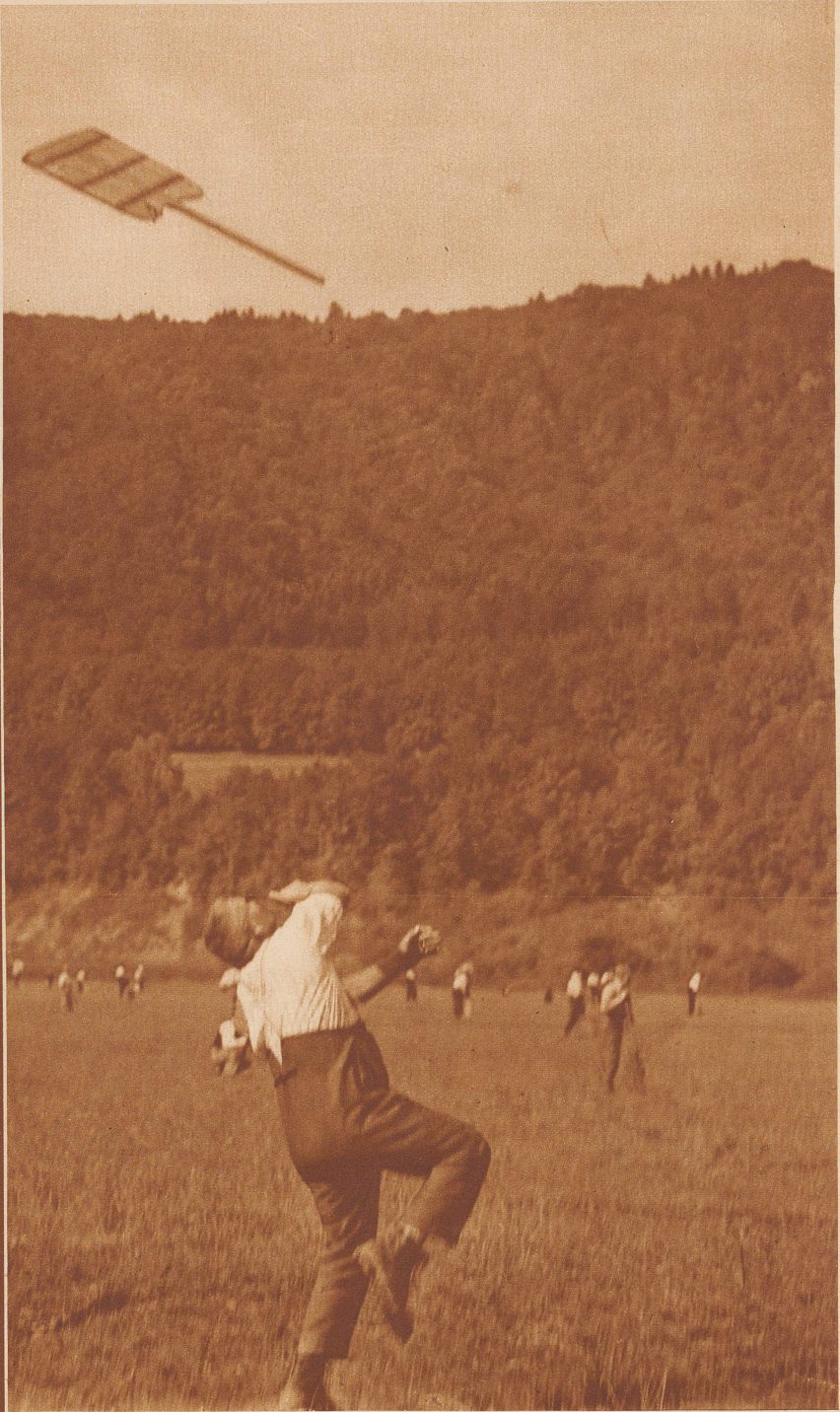
Mit wohlgezieltem Schuß der Schindel in die Luft wird der heransausende Hornuß abgetan

Bei den Eidgenössischen Schwing- und Aelplerfest in Zürich