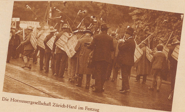
Die Hornussergesellschaft Zürich-Hard im Festzug