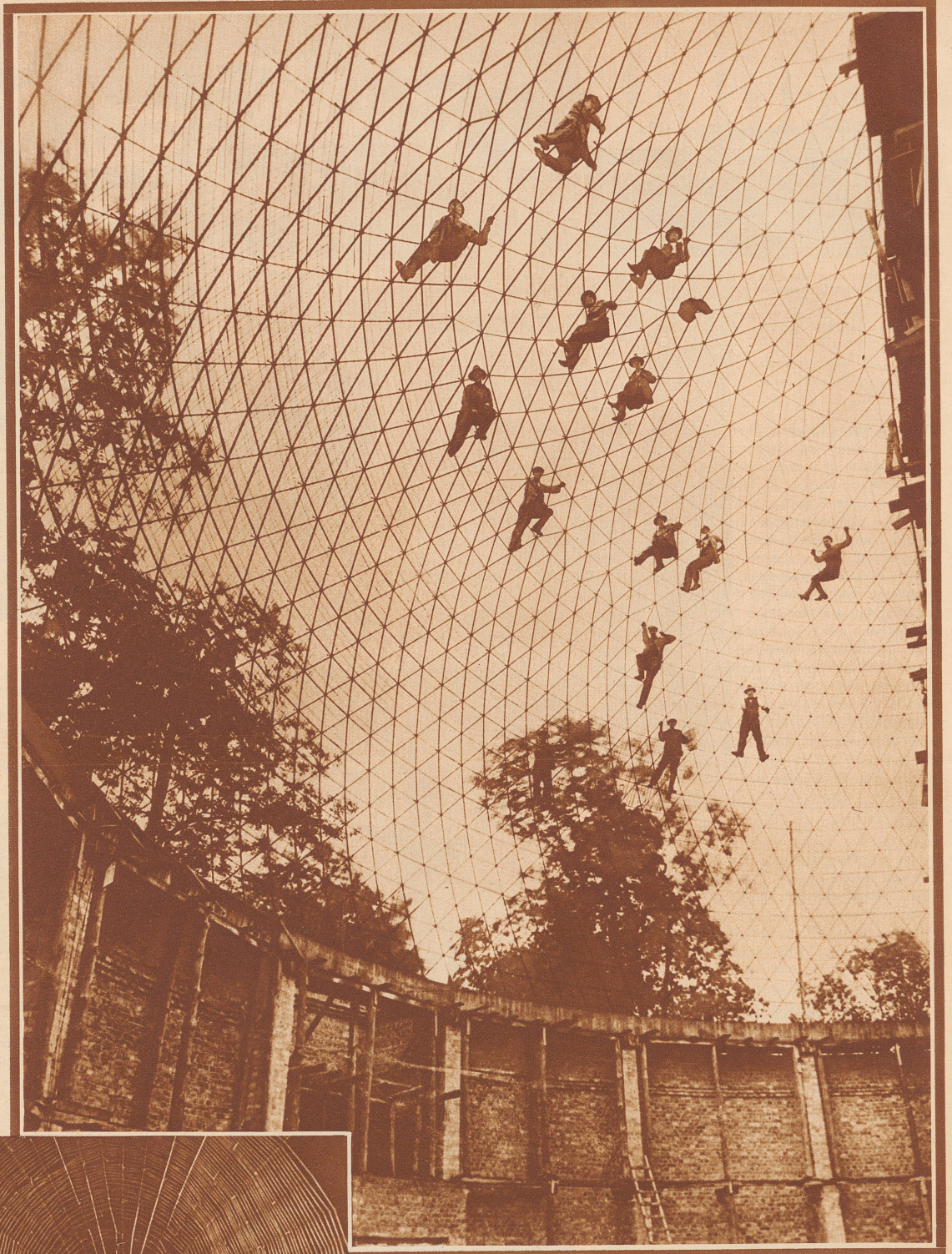
KREUZSPINNE IM NETZ

STERNWARTE IM BAU Die Grundmauern sind fertig. Man ist an der Konstruktion des Gewölbes. Ein eisernes Netzwerk ist dessen Grundlage und Bürgschaft gegen jede Einsturzmöglichkeit. Man beachte die Unterschiede in den Größenverhältnissen der im Netzwerk stehenden Arbeiter; daran zeigen sich die beträchtlichen Ausmaße dieses eisernen Spinnennetzes