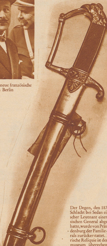
Der Degen, den 1870 bei der Schlacht bei Sedan ein preussischer Leutnant einem französischen General abgenommen hatte, wurde von Präsident Hindenburg der Familie des Generals zurückerstattet. Die historische Reliquie ist dem Armeemuseum übergeben worden