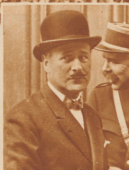
François Poncet , der neue französische Botschafter in Berlin

In Madrid trafen sich zu wichtigen politischen Besprechungen der Präsident der spanischen Republik, Alcázar Zamora (links) und der Präsident von Katalonien, Oberst Macia (rechts). Oberst Macia ist der geistige Führer der katalonischen Separatisten, deren Ziel darin besteht, Katalonien zu einer selbständigen Republik zu erheben