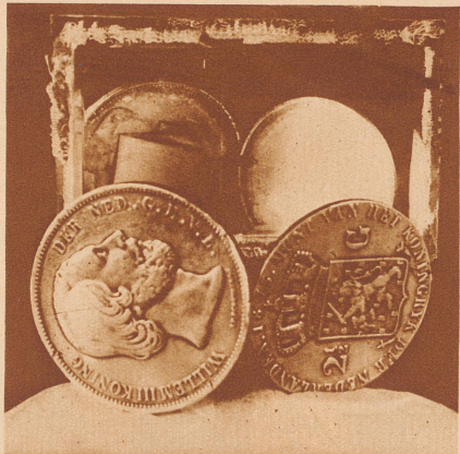
Holländisches 2 1/2 Guldenstück, von einem englischen Spion zur Nachrichtenübermittlung benutzt. Das Geldstück ist entzweigeschnitten und ausgehöhlt. Die zwei Hälften konnten aufeinandergepaßt werden, während in der Höhlung die zu übermittelnde Nachricht verborgen war