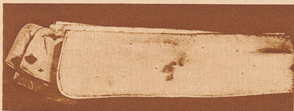
Leinener Kragen, im britischen Imperial War Museum in London aufbewahrt, der als Schreibmaterial für Geheimtinte diente

Wenn heute in manchen Büchern, die sich mit der Spionage befassen, von dem «kindlichen Mittel der unsichtbaren Tinte» geschrieben wird, so kann man getrost entgegennehmen, daß die meisten Spione trotz alledem dieses «kindliche Mittel» benutzt haben. Im britischen Imperial War Museum, wo eine ganze Reihe sehr interessanter Dokumente der Spionage ausgestellt sind, sieht man einen weichen Kragen, den ein deutscher Spion als Schreibmaterial benutzte. Er schrieb seine Nachrichten mit unsichtbarer Tinte darauf. Ein anderer Spion benutzte einen präparierten Talkumpuder zum Schreiben, ein dritter verwahrte seine Geheimtinte in einer Mundwasserflasche. Sehr interessant ist ein Stück Seife, das ebenfalls im Londoner Museum zu sehen ist.