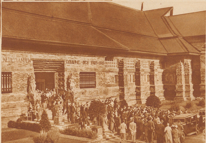
Der neuerbaute holländische Pavillon an der Pariser Kolonialausstellung. In der kurzen Zeit von sechs Wochen ist der durch Feuer zerstörte Prachtbau der Holländer aus der Asche wieder erstanden