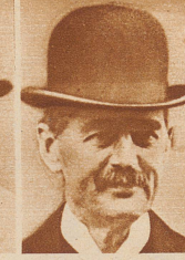
Sir John Austus Chamberlain, Gesundheitsminister (Konservativ)