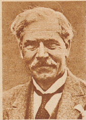
Ramsay Mac Donald, Premierminister (Labour Party)