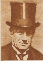
Lord Stanley Baldwin, Präsident des Geheimen Rates und Minister ohne Portfeuille (Konservativ)