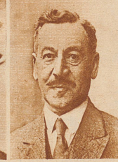
Sir Herbert Samuel, Innenminister (Liberal)