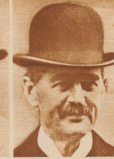
Sir John Austus Chamberlain, Gesundheitsminister (Konservativ)