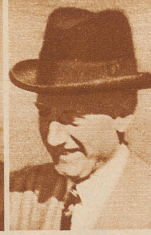
Sir Hoare, Staatssekretär für Indien (Konservativ)