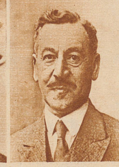
Sir Herbert Samuel, Innenminister (Liberal)