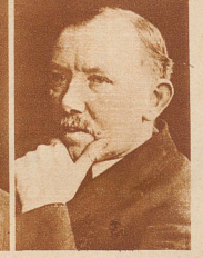
James Henri Thomas, Kolonialminister (Labour Party)