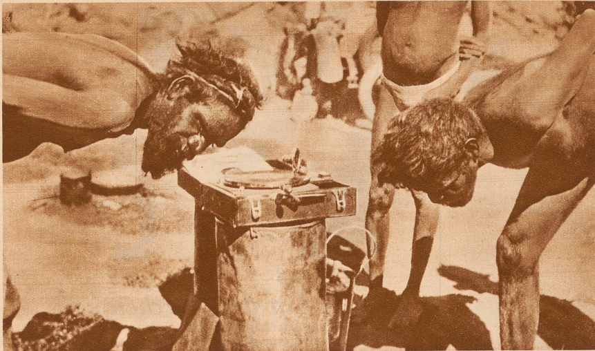
NEUES AUS EUROPA!