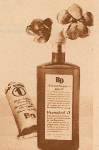
Hautnähröl VI kostet Fr. 4.25 die Flasche

Für Sie sogar, geehrte Dame! — Auf der Straße, bei Anlässen, wie oft schon sind Sie Frauen begegnet, die durch ihre reine und weiche Gesichtshaut Ihre Blicke fesselten? Sie vermuteten fast ein Geheimnis, irgendeine persönliche, kostspielige Behandlung.