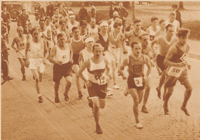
Die Läufer kurz nach dem Start in Luzern