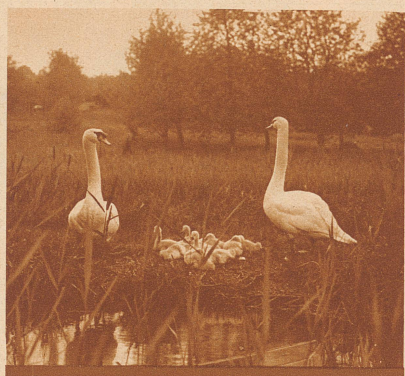
SCHWANE AM HALLWILER SEE

Wie diese Schwäne ihre Brut beschützen, so wachen kundige Hände über die Herstellung einer stets guten Qualität der bekannten