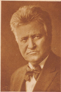
Robert M. La Follette der nordamerikanische Senator waadtändischer Abstammung, einer der bedeutendsten Volkswirtschaftler in U.S.A., war 1928 Präsidentschaftskandidat

Es war im Herbst 1912. Die Welt wußte nichts vom Weltkrieg, wenig von Briand und noch weniger von Rationalisierung und Reparationen. Aber in aller Erinnerung stand noch die große Krise von 1907 auf 1908. Die Uhrmacher des Jura so gut wie die Sticker der Ostschweiz dachten noch mit Schrecken an jenen verdienstlosen Winter 1907/8 zurück, in dem die Ausfuhr ihrer Produkte gestockt hatte wie vorher nie. — In den Vereinigten Staaten waren die Städte von Obdachlosen überfüllt. Hungertod bei Männern, Frauen und Kindern war dort häufiger als die amtlichen Berichte aufzudecken wagten. Obdachlose begingen absichtlich Gesetzesübertretungen, um im Gefängnis versorgt zu werden. Die sozial-ethische Liga der Stadt New York berichtete, daß 6 Monate nach Ausbruch der Krise die Zahl der Verbrechen um 50 Prozent gestiegen war. Man schätzte die Verminderung des Volksvermögens in den Vereinigten Staaten infolge der Krise auf 30 Milliarden Dollar. Mindestens 5 Millionen Arbeiter waren hier arbeitslos — eine Zahl, die im Vergleich zur damaligen Bevölkerung der Vereinigten Staaten auch heute noch kaum erreicht ist.