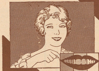
Montag Dienstag Mittwoch 3 Nuancen weisser

Ischias, Hexenschuß, Erkältungskrankheiten. Löst die Harnsäure! Über 6000 Ärzte-Gutachten! Wirkt selbst in veralteten Fällen.