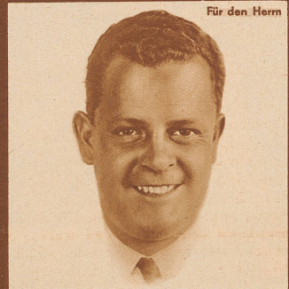
Für den Herrn