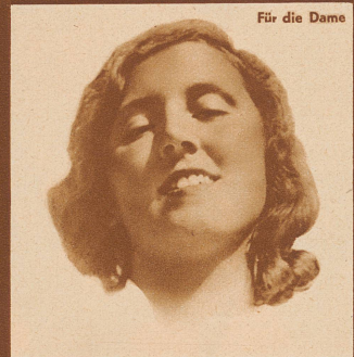
Für die Dame