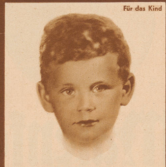
Für das Kind

FABRIKANTEN: TRICOTFABRIK NABHOLZ A.-G., SCHÖNENWERD