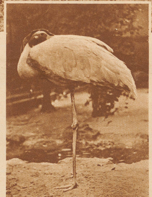
Bild links: Auf einem einzigen Ständer, den andern hochgezogen und im Bauchgefieder versteckt, den Kopf an den Rücken zurückgelegt, steht schlafend am Weiher der Kranich

Bild links: Das Kamel in der Schlafelage bietet einen ungewohnten Anblick: Es hat an Brust, an Knien, Ellenbogen und Fersengelenken harte Hornschwien, auf denen der Körper in Ruhestellung aufliegt