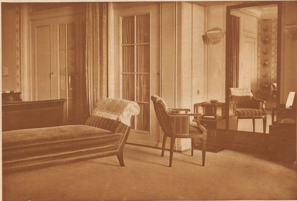
Schlafzimmer aus dem Grand Hotel Dolder in Zürich. Innenausbau: In Schleiffack. Möbel: In Drappé Mahagony pol. Ausgeführt von Carl Hotz, Möbel-fabrik Märstetten, Thurgau. Abbildungen sowie Musterzimmer meiner Spezialfabrikate in schönen Speise-, Schlaf-, Herren- und Wohnzimmern, in der Preisliste von ca. Fr. 2500.- sind für jeden Käufer interessant.

heißt Eigenfabrikat. Seit Jahren unübertroffen in Qualität und Preis