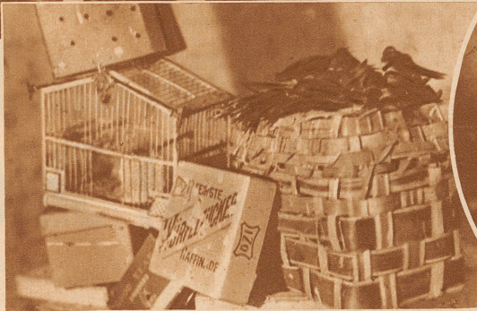
In die Dachkammer eines Miethauses in Wien haben sich viele Hunderte halbrörene Schwalben geflüchtet