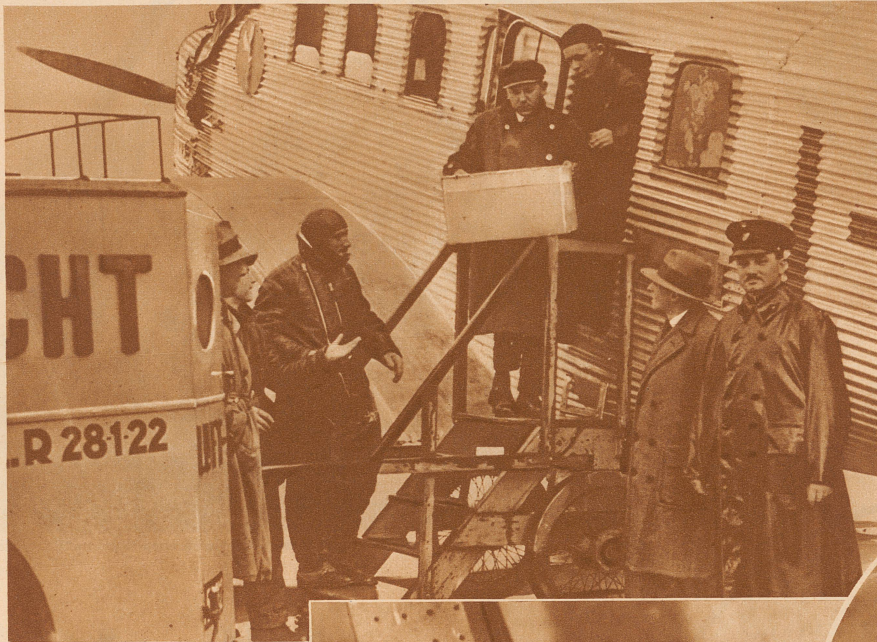
Ein ganzes Flugzeug voller Schwalben