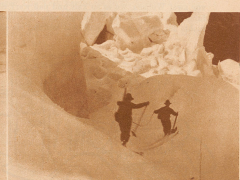
Querren einer Spalte in den Eisbrüden des Kühllanenenhorns