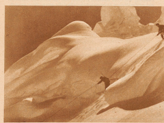
Schlafahrt durch die Spalten hinter dem kleinen Silberhorn