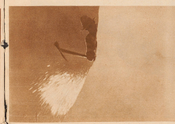
Langsame und mühsame Eisarbeit vor dem Abstieg über eine Eiswand auf dem Kühllanenenhorns