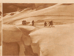
Vorsichtige Fahrt am gestirften Sell über den Guggletscher