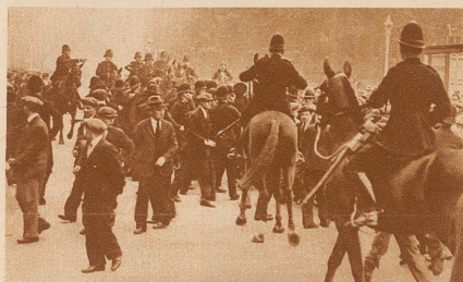
Berittene Polizei geht gegen die Teilnehmer an einer Arbeitslosen-Demonstration vor