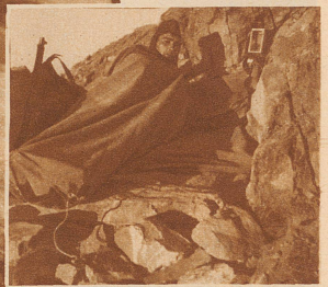
Nacht-Biwak nahe der 3000 Meter-Grenze auf dem Lenzerhorn. Auf hergerichteter Steinlager, in die Zeltsäcke gehüllt und angeleitet, verbrachte die Hochgebirgspatrouille des Geb.-Inf.-Bat. 93 eine Manövernacht