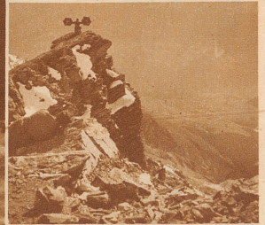
Signalmann der Hochgebirgspatrouille des Geb.-Infanterie-Bat. 93 auf dem Gipfel des Lenzerhorns