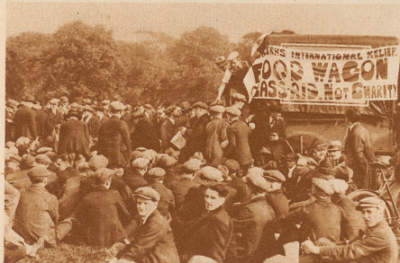
Massen-Meeting der Internationalen Arbeiterhilfe im Hyde-Park in London. In ununterbrochener Folge sprechen während des ganzen Tages Redner über die Lage und die Hilfsmöglichkeiten. Da die Zuhörer aus allen Teilen der Riesenstadt zu Fuß herbeizien und bis spät am Abend blieben, wird in einem improvisierten Küchenwagen Suppe und Kartoffeln gekocht und gratis an die Arbeitslosen abgegeben