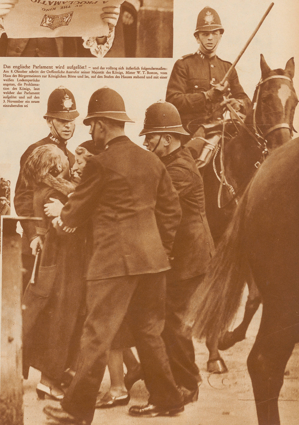
Bild rechts: Vier Polizisten zu Pferd und zu Fuß bemühen sich, zwei Demonstrantinnen, die sich wild wehren, abzuführen