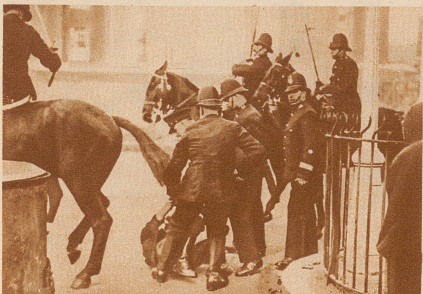
Ein Demonstrant wird von der Polizei überwältigt und verhaftet