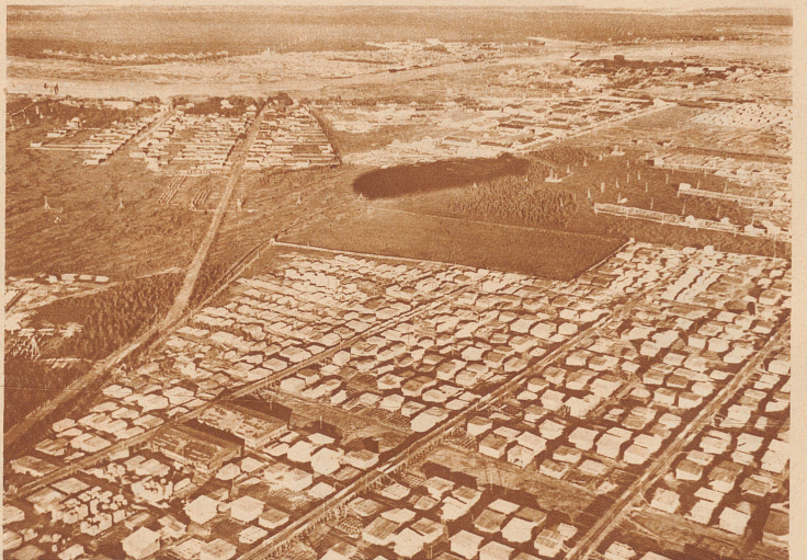
Der Zeppelinschatten über Archangelsk, der Stadt im höchsten Norden Rußlands, wo Samoilowitsch seine Verbannungzeit erlebte. Im Vordergrund die mächtigen Holzlager der russischen Staatsverwaltung

Unser Landsmann W. Bosshard hat im Auftrage der «Berliner Illustrirten Zeitung» als einziger Bildberichter- statter die Expedition mitgemacht