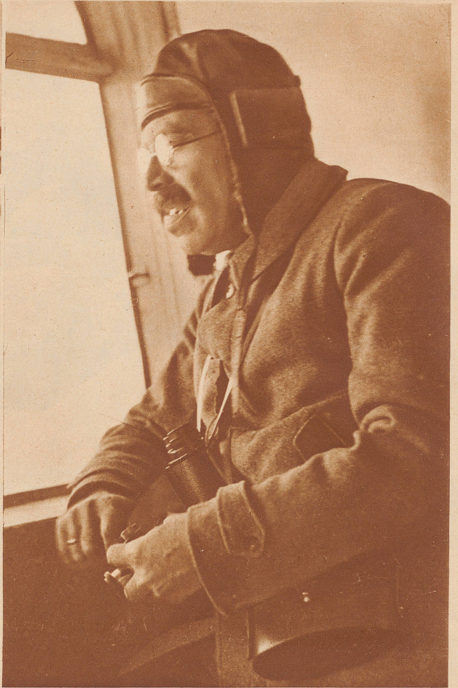
Professor Samoilowitsch hält am Fenster der Kabine Ausschau nach unbekanntem Inseln im Eismeer

Ein bisher unbekannter Gebirgszug auf Nordland (früher Nikolaus II-Land), der während des Polarfluges von Professor Samoilowitsch entdeckt wurde