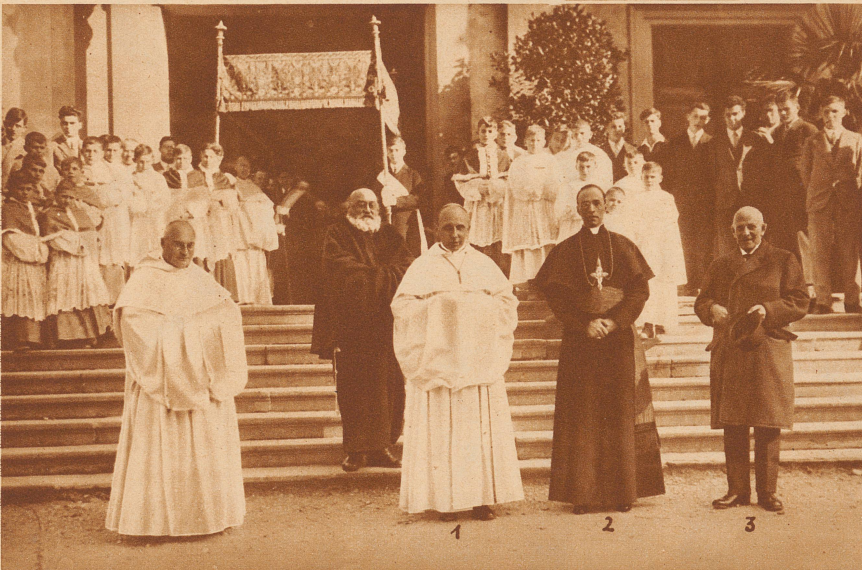
Kardinal-Staatssekretär E. Pacelli im Kloster Mehrerau anlässlich der Kirchweihe und des 77. Jahrestages des Einzugs der Zisterzienser. 1. Abt Cassian Haid; 2. Kardinalstaatssekretär Pacelli; 3. Der österreichische a. Bundeskanzler Ender Aufnahme Baumgartner