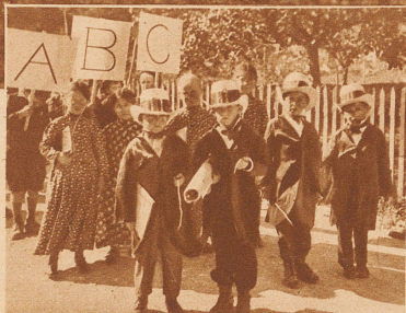
Kindergruppe aus dem Festzug der Schulhausweihe