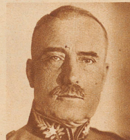
Oberstkorpskommandant O. Bridler der Senior der Einheitskommandanten des schweiz. Milizheeres, tritt altershalber von der Führung des 2. Armeekorps zurück. Oberst Bridler, ursprünglich Architekt, trat 1889 als Berufsoffizier in die Armee ein, machte eine glänzende Karriere und bekleidete nun seit 8 Jahren eine der höchsten Stellen, die unser Land in Friedenszeiten zu vergeben hat