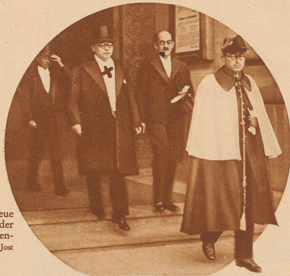
Minister Wood x, der neue chinesische Gesandte bei der Schweizerischen Eidgenossenschaft