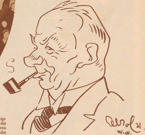
Der Führer der siegreichen Konservativen Mr. Stanley Baldwin