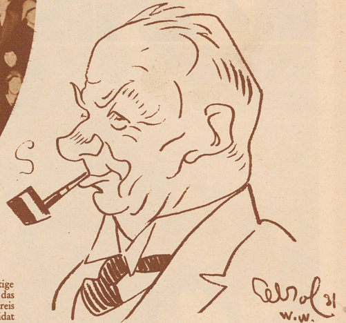
Der Führer der siegreichen Konservativen Mr. Stanley Baldwin