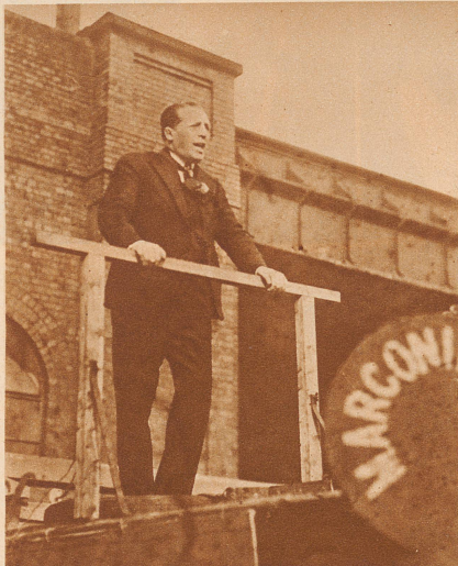
Für Whitechapel, das Armenviertel von London, war der Boxmeister Kid Lewis vorgeschlagen. Aufgestellt hat ihn Sir Oswald Mosley, der Begründer der «New Party», vielleicht weil er kurz vorher in seinem Distrikt heftig verprügelt worden war. Kid Lewis fiel aber durch. Er verlor sogar seine Hinterlegung von 150 Pfund, da er nicht die gewisse festgesetzte Mindestzahl von Stimmen erhielt. - Bild: Kid Lewis auf der Tribüne