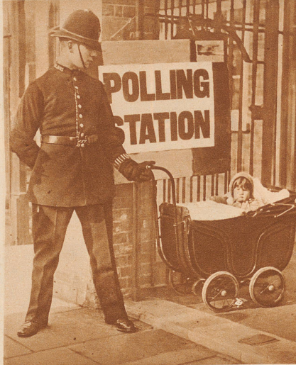
Vor einem englischen Wahllokal. Ein Anblick, wie ihn die schweizerischen Nationalratswahlen vorläufig nicht zu bieten vermögen. Die Mutter hat Stimmrecht, sie erfüllt im Wahllokal ihre wäterländische Pflicht, der liebenswürdige Londoner Polizeibeamte vertritt sie beim Kinderwagen