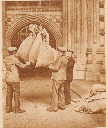
Millionen gebrauchter Stimmzettel kommen aus allen Teilen des Landes nach der Wahl in Säcken in das Parlamentsgebäude. Hier werden sie in den Urkundensaal des Viktoria-Turms hinaufgeschafft und bleiben für ein Jahr und einen Tag da. Hierauf gehen sie an das Schreibwarenamt seiner Majestät und werden eingestampft

Die «Zürcher Illustrierte» erscheint Freitags • Schweizer Abonnementspreise: Vierteljährlich Fr. 3.40, halbjährlich Fr. 6.40, jährlich Fr. 12.—. Bei der Post 30 Cts. mehr. Postscheck-Konto für Abonnements: Zürich VIII 3790 • Auslands-Abonnementspreise: Beim Versand als Drucksache: Vierteljährlich Fr. 4.50 bzw. Fr. 5.25, halbjährlich Fr. 8.65 bzw. Fr. 10.20, jährlich Fr. 16.70 bzw. Fr. 19.80. In den Ländern des Welpostvereins bei Bestellung am Postschalter etwas billiger. Insertionspreise: Die einspaltige Millimeterzeile Fr. — 60, fürs Ausland Fr. — 75; bei Platzvorschrift Fr. — 75, fürs Ausland Fr. 1.—. Schluß der Inseraten-Aufnahme: 14 Tage vor Erscheinen. Postscheck-Konto für Inserate: Zürich VIII 15769 Redaktion: Arnold Kähler, Chef-Redaktor. Der Nachdruck von Bildern und Texten ist nur mit ausdrücklicher Genehmigung der Redaktion gestattet.