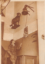
Hier im Vestibül des Hauptgebüdes des Hospiz ist ein in die Wand nicht eingewandelter berühmter (Bary), der 30 Menschen das Leben rettete, und dem von einem Tausend erbauten wurde, der im Irrenheim für einen Wolf hielt