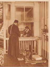
Das Postbureau - Hospiz Großer St. Bernhard, gewöhnlich verwaltet von einem Augustiner-Pater