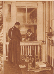
Das Postbureau «Hospiz Gröden St. Bernhard», gewöhnlich verwaltet von einem Augustiner-Pater