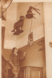
Hier im Vorbau des Hauptgebüdes des Hospiz sehen im Wind nicht ungeschützt der berühmte (Bary), der 30 Menschen das Leben rettete, und kein von einem Tauchern ertrunken wurde, der im Irrenheim für einen Wolf hielt