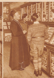
Das Museum, das besonders reich an römischen Altertümern ist