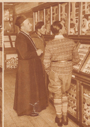
Das Museum, das besonders reich an römischen Altertümern ist