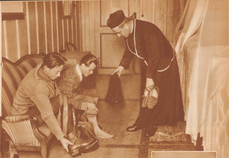
Im Hospiz werden die fremden Gäste vom Prior gastfreundlich mit der traditionellen Gabe, einem Paar warmer Hausschuhe, empfangen. Das ist fast so, als käme man zur Mutter nach Hause

Prior eine gute Flasche Wein spendiert hatte, erklärte er die Lage für ernst; sämtliche vier Telefonverbindungen nach dem Tal waren gerissen und das Barometer sank noch immer. Wir hielten es für Scherz, als er uns versicherte, daß wir mit 14 Tagen Anstiehl rechnen müßten. Den Prior und die Knechte fragten wir täglich wohl zehnmal, ob er nicht denke, daß das Wetter besser werde. Wir truben uns im Kloster herum, spielten mit den Händen, langerten in den Polsterseilen des Salons, kletterten auf dem Klavier und suchten im Gästebuch nach berühmten Namen.