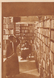
Die Bibliothek des Klosters enthält mehr als 20000 Bände aus allen Wissensgebieten