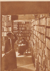
Die Bibliothek des Klosters enthält mehr als 20000 Bände aus allen Wissensgebieten