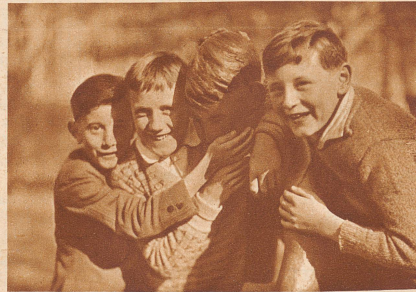
... ihre Mappe beim Erzmann wieder abholen, nicht ohne ihm zum Dank für seine Dienste die kalte Backe zu streicheln!