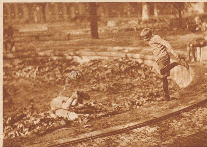
Nachher sind sie frei und ledig, spielen Fangis auf der Wiese, bis sie gehen müssen und ...