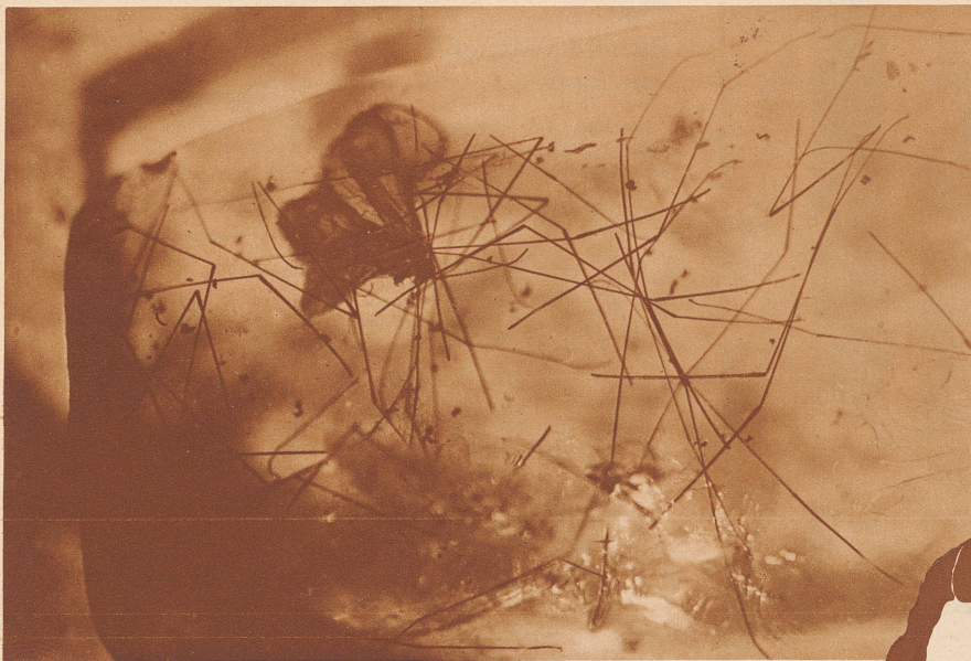
Ein Schlachtfeld, das älter ist als alle Menschen, — lest, was ich darüber zu berichten weiß!

Liebe Kinder, mein Freund Schnugg sammelt alle Arten kuriose Sachen: Bücher, Bilder, Ketten, Möbel, ausgestopfte Tiere und vieles andere, was kein Mensch mehr haben will. Manchmal ergattert er etwas besonders Wertvolles, das kann er dann gut verkaufen. Letzten Sonntag ging ich ihn besuchen und stöberte gehörig in dem alten Kram herum, viele Stunden lang. Ich bekam staubige Hände und einen heißen Kopf und wollte eben wieder gehen, — da fiel die Sonne durch das Fenster, und oben auf einem alten Kasten leuchtete etwas auf, daß ich meinte, es sei Gold. Schnugg holte es herunter. Es war ein goldgelb funkelnder, durchsichtiger Stein, etwa so groß wie ein kleiner Pfirsich. Wenn man ihn gegen das Licht hielt, sah man, daß tief drinnen ein kleines Insekt saß und kreuz und quer liefen viele dünne dunkle Linien. «Das sieht ja fast aus wie Fliegenbeine», murmelte ich. «Sind auch Fliegenbeine», sagte Schnugg feierlich, «aber keine gewöhnlichen: diese Fliegenbeine sind viele Millionen Jahre