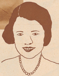
Der uralte Bernstein wird nachher eine ganz neue Kette für das Liseli

alt! Vor vielen Millionen Jahren war der kleine Stein, den du in der Hand hältst, flüssig, war ein Harz, das aus einer Kiefer tropfte; die Kiefer aber stand mit vielen anderen in Norddeutschland, auf weiten Landflächen, die es jetzt nicht mehr gibt, — sie sind vom Meer bedeckt. Das fein duftende Kieferharz, das so schön glänzte, lockte immer viele Fliegen und Mücken an; gerade so wie die Fliegen bei uns jetzt immer gegen die Lampe schwirren, flogen sie damals auf das gelbe Harz, — und dann waren sie gefangen. Manche konnte sich noch losreißen, aber ihre Beine blieben kleben. Andere aber wurden ganz eingeschlossen, nicht nur Fliegen, auch Schmetterlinge. Spinnen und hie und da kleine Eidechsen. Nachher tropfte das Harz zu Boden. Als dann die große Meerflut über das Land kam, packte sie die Stämme abgestorbener Bäume und die Harzklümpchen am Waldesboden, spülte alles mit sich und begrub es