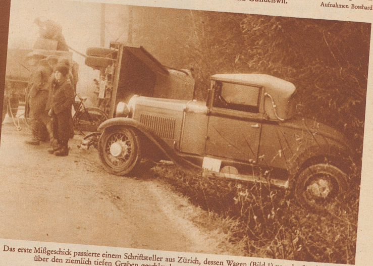
Das erste Mißgeschick passierte einem Schriftsteller aus Zürich, dessen Wagen (Bild 1) von der Straße weg quer über den ziemlich tiefen Graben geschleudert wurde, ohne irgendwie Schaden zu nehmen