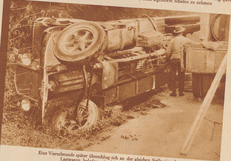
Eine Viertelstunde später überschlug sich an der gleichen Stelle ein schwerer Lastwagen, beladen mit einigen Tausend Liter Sauser