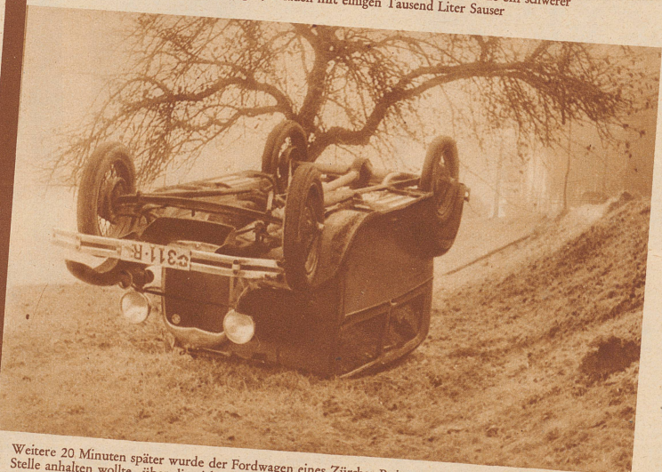
Weitere 20 Minuten später wurde der Fordwagen eines Zürcher Reisevertreters, der an der verhängnisvollen Stelle anhalten wollte, über die zirka 2 Meter hohe Böschung geschleudert und blieb auf dem Rücken in der Weise liegen. Wagen und Insasse kamen nur ganz unerheblich zu Schaden