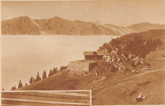
Die neue Klub- und Skihütte Brunni der Sektion Enggelberg des S. A. C. Die Hütte steht 1870 Meter über Meer im schönsten Tourengbiet und enthält 40 Schlafplätze