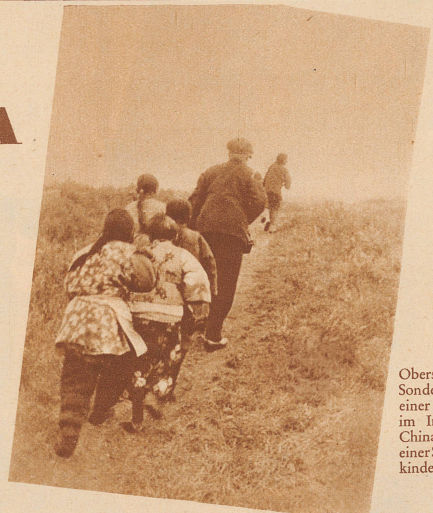
Oberst Sonderegger auf einer Exkursion im Innern von China wird von einer Schar Bettelkinder verfolgt