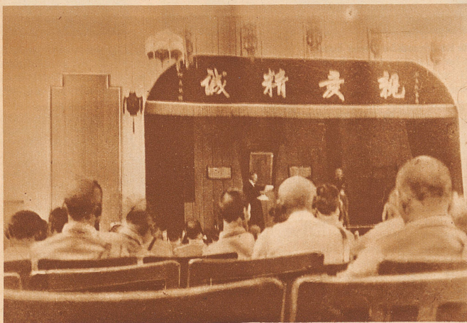
Der ehemalige schweizerische Generalstabschef hält vor einer Anzahl höherer Offiziere einen Vortrag über moderne Landesverteidigung. An der Wand im Hintergrund das Bild des chinesischen Nationalhelden Dr. Sun-Yat-Sen