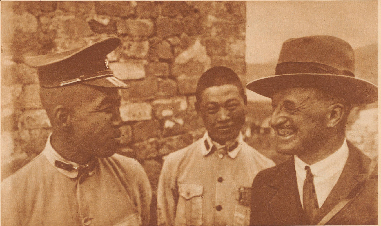
Oberstdivisionär Sonderegger im Gespräch mit einer Wache beim Eingang zur Stadt Nanking