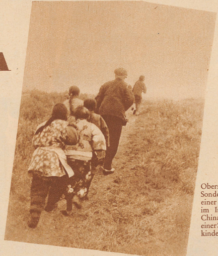
Oberst Sonderegger auf einer Exkursion im Innern von China wird von einer Schar Bettelkinder verfolgt