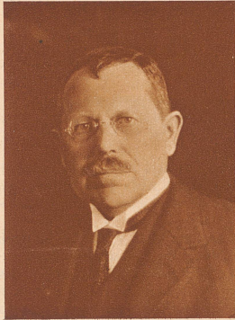
Professor Dr. F. de Quervain dem bekannten Chirurgen. De Quervain ist geboren 1868 in Sitten, war 1895—1910 Arzt in La Chaux-de-Fonds, 1910—1918 Vorseher der Chirurgischen Universitätsklinik Basel und wirkte seit 1918 in derselben Eigenschaft an der Universität Bern.