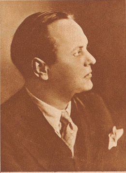
Friedrich Sieburg dem erfolgreichen Schriftsteller und Journalisten. Er war Vertreter der Frankfurter Zeitung, zuerst in Kopenhagen, dann 1926—1930 in Paris und berichtet augenblicklich aus London. Seine politische Tätigkeit in Paris schloß er mit dem Buche «Gott in Frankreich» ab, das in Deutschland wie in Frankreich einen nachhaltigen Erfolg hatte. Sieburg nahm an der Arktisfahrt des «Malygin» als Berichterstatter teil.