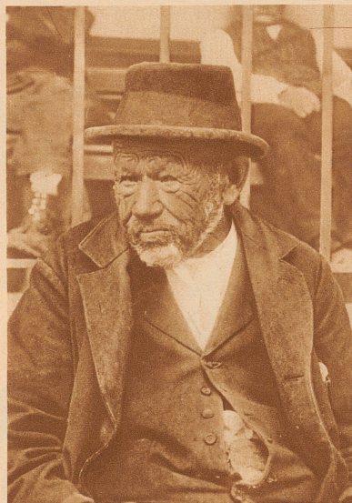
Er war viel an Wind und Wetter. Es ist hart, am Ende eines arbeitsreichen Lebens nichts zu besitzen