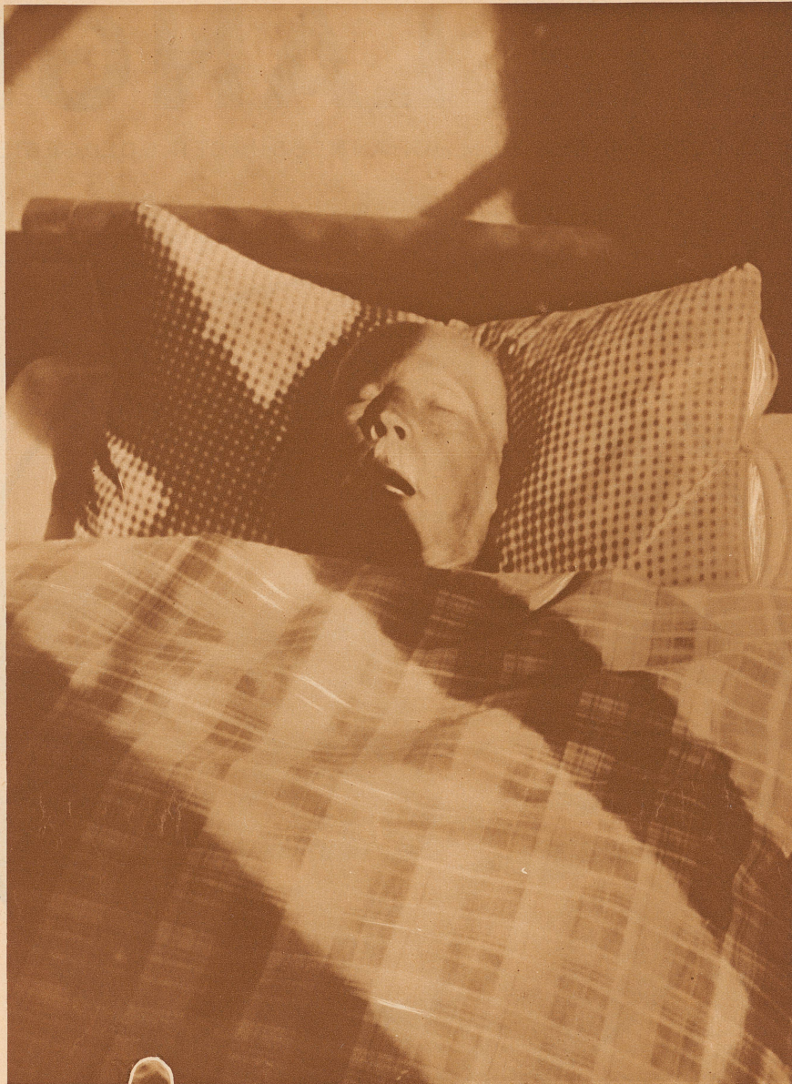
Einsamer Alter! Die Nachmittagssonne scheint in sein Zimmer. Er schläft