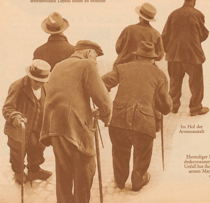
Im Hof der Armenanstalt