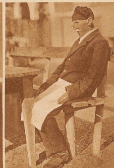
Ein 83jähriger Schneider wärmt sich in der Herbstsonne