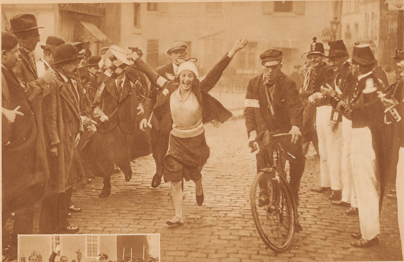
Die Siegerin im Wetlauf der kleinen Midinettes von Paris, den sie alljährlich an ihrem großen Festtag, dem Tag der Heiligen Katharina, am 25. November abhalten. Nur die dürfen mitmachen, die über 25 Jahre sind; die andern haben es noch nicht nötig, denn die Heilige Katharina soll ihren Anhängerinnen im kommenden Jahr einen Mann verschaffen