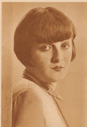
Am 27. November starb im Harbourn-Krankenhaus in New York die bekannte Filmschauspielerin Lya de Putti an den Folgen einer Kehlkopfoperation. Die junge Ungarin war durch mehrere große Rollen in summen Filmen («Das indische Grabmal», «Variété») berühmt geworden