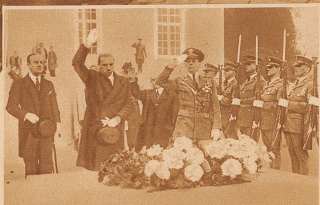
Der italienische Außenminister Grandi legte bei seinem Besuch in Amerika am Grab des Unbekannten Soldaten im Friedhof von Arlington mit faschistischem Gruß einen Kranz nieder. Neben ihm der amerikanische General Collins