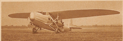
Ein neuer Dornier. Auf dem Flugplatz Dübendorf wurde vergangene Woche das neue Dornier-Verkehrsflugzeug Do K vorgeführt. Dieser Do K ist ein freitragender Eindecker mit den respektablen Ausmaßen von 25 m Spannweite und 16,65 m Länge. Er bietet 10 Personen Platz und hat eine Reisegeschwindigkeit von 200 km in der Stunde. Zum Antrieb dienen vier 220 PS-Motoren, aber auch zwei Motoren genügen, um ihn in der Luft zu halten