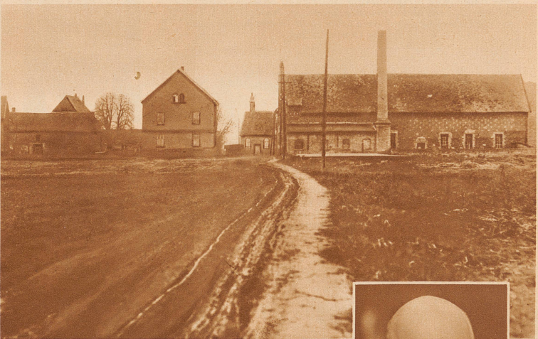
Der Boxheimer Hof in Lampertheim am Rhein, in dem von Führern der nationalsozialistischen Partei ein genaues Regierungsprogramm für den Fall eines Rechts-Umsturzes ausgearbeitet wurde

Deutschland ist beunruhigt durch die Aufdeckung eines nationalsozialistischen hochverräterischen Diktaturplanes in Lampertheim (Hessen), der durch einen ehemaligen führenden Nationalsozialisten, Dr. Schäfer denunziert und von Minister Severing dem Reichsgericht in Leipzig übergeben wurde.