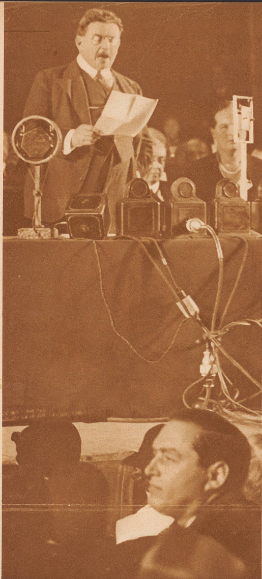
Eduard Herriot sprach an der großen öffentlichen Schlußsitzung des Kongresses über den Kampf gegen die «vieltausendjährige Barbarei des Krieges». Schon während seiner Rede begannen in den Rängen und Logen blutige Schlägereien zwischen Abrüstungsfreunden und -Gegnern