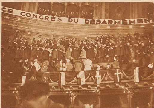
Der große Saal des Trocadéro während der Tumulte und Kundgebungen gegen den deutschen Redner, den Reichstagsabgeordneten Joos

Tumult am Abrüstungskongress. Von 362 pazifistischen und linksstehenden Organisationen wurde in Paris ein Abrüstungskongress einberufen, an dem 1043 Delegierte aus 40 Ländern zusammenkamen. Schon während der Kongreßverhandlungen selbst kam es zu Unstimmigkeiten zwischen den verschiedenen Richtungen; zu einem großen Skandal und zu Tumultszenen aber kam es an der großen öffentlichen Schlußversammlung, an welcher rechtsstehende ehemalige Kriegsteilnehmer und Nationalisten durch Pfeifen, Lärm und Schlägereien gegen die Tendenzen des Kongresses demonstrierten.